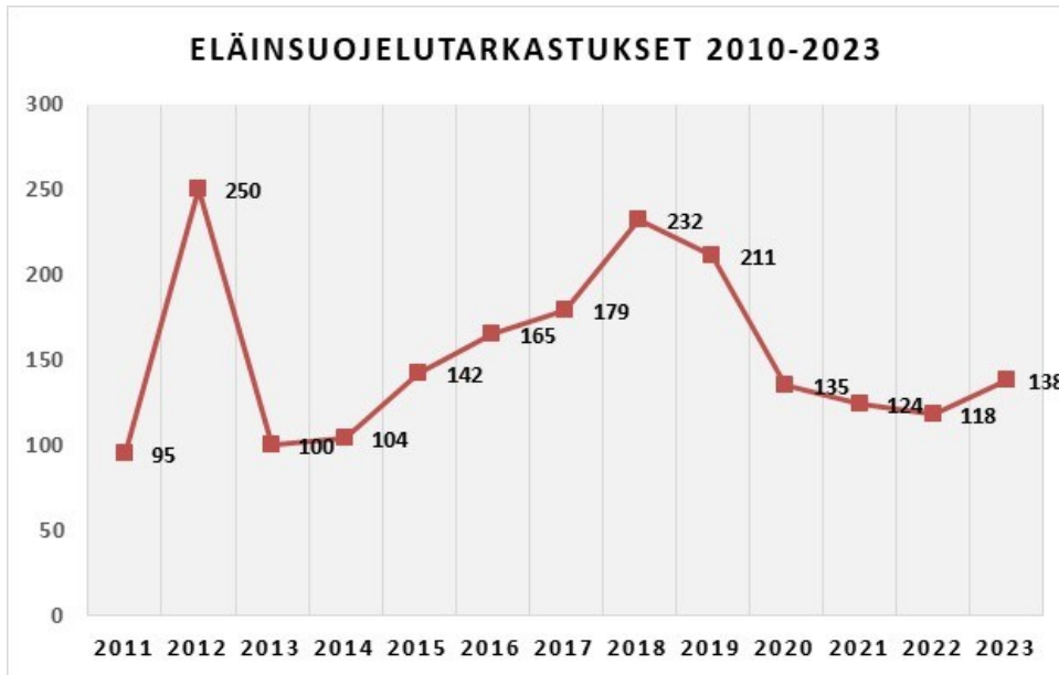
Kuva 2. Eläinsuojelutarkastuksien määrän kehitys