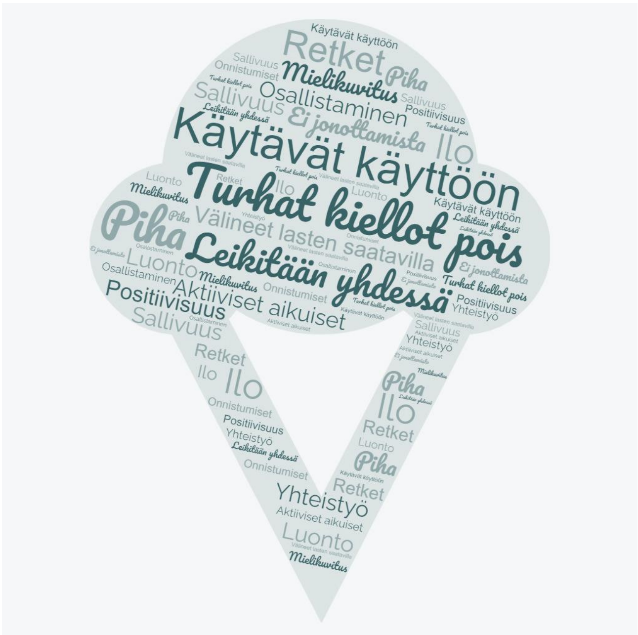
Kuva 2. Kokkolan liikuntavastaavien ajatuksia lapsilähtöisestä liikuntakasvatuksesta

Lähiluonto, rakennettu ympäristö ja digitaaliset ympäristöt tarjoavat monenlaisia oppimisympäristöjä, joita hyödynnetään säännöllisesti ja suunnitelmallisesti. Kokkolassa on hyvät lähiliikuntapaikat, joiden hyödyntäminen monipuolistaa varhaiskasvatuksen toimintaa. Yhteistyö paikallisten liikunta- ja kulttuuritoimijoiden kanssa rikastaa lasten oppimisympäristöjä. Erilaisia digitaalisia sovelluksia ja alustoja voidaan käyttää oppimisen alueiden käsittelyssä, huoltajien kanssa tehtävässä yhteistyössä ja pedagogisen toiminnan dokumentaation apuvälineenä. Digitaalisiin välineisiin tutustutaan ja niitä hyödynnetään lasten ikätaso, tarpeet ja mielenkiinnon kohteet huomioiden. Huoltajia kannustetaan tukemaan lasten liikunnallisten taitojen kehittymistä liikkumalla yhdessä lastensa kanssa.