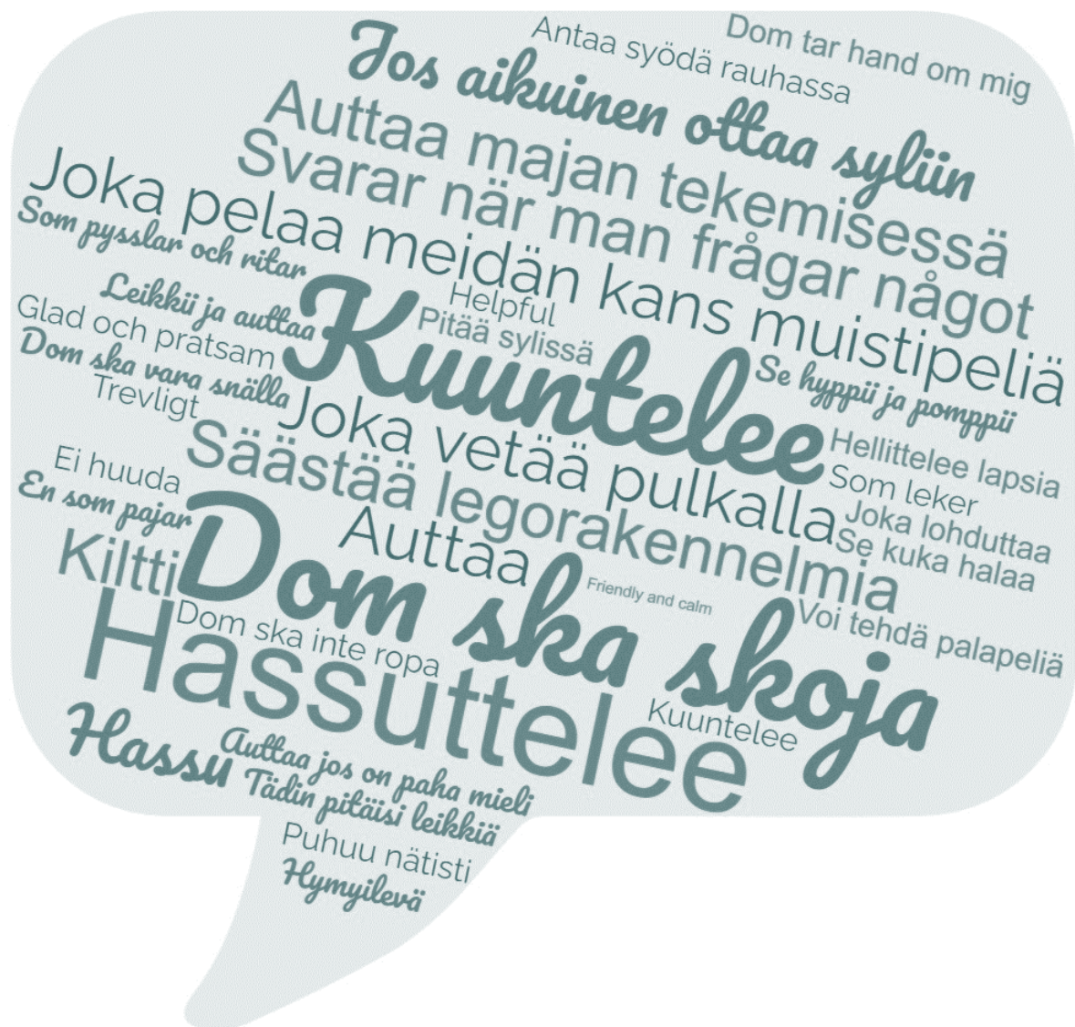
Kuva 1. "Minkälainen on kiva aikuinen?" Lasten vastauksia varhaiskasvatuksen toiminnan arvioinnin kyselyssä 2022.

Johtamisella on keskeinen merkitys toimintakulttuurin kehittämiseen ja laatuun. Kokkolan kaupungin varhaiskasvatuksessa johtajuuteen kuuluu yksikön toimintakulttuurin kehittäminen yhdessä lasten, huoltajien ja henkilöstön kanssa. Päämääränä on, että yhteinen toiminta-ajatus ja toiminnan tavoitteet näkyvät käytännöissä. Johtaja vastaa siitä, että yhteisiä työkäytäntöjä tehdään näkyväksi ja että niitä havainnoidaan ja arvioidaan säännöllisesti. Toimintakauden alussa laaditaan esimiehen johdolla yksikön toimintasuunnitelma (tosu), johon kirjataan muun muassa keskeisiä yksikön toimintaperiaatteita, toimintakauden painopistealueet ja kehittämiskohteet. Yksikön toimintasuunnitelmasta kerrotaan tarkemmin luvussa 8.