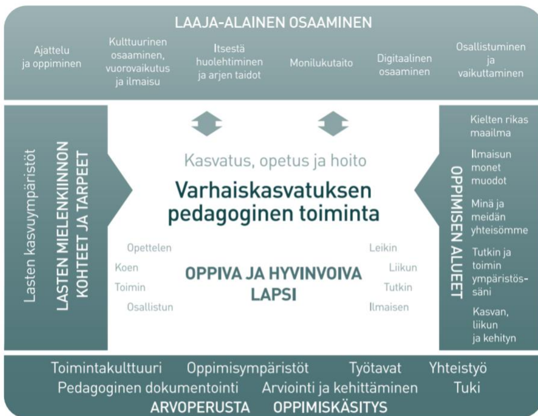
Kuvio 2. Varhaiskasvatuksen pedagogisen toiminnan viitekehys

Varhaiskasvatuksen pedagogista toimintaa ja sen toteuttamista kuvaa kokonaisvaltaisuus. Tavoitteena on edistää lasten oppimista ja hyvinvointia sekä laaja-alaista osaamista (kuvio 2). Pedagoginen toiminta toteutuu lasten ja henkilöstön välisessä vuorovaikutuksessa ja yhteisessä toiminnassa. Lasten omaehtoinen, henkilöstön ja lasten yhdessä ideoima sekä henkilöstön suunnittelema toiminta täydentävät toisiaan. Varhaiskasvatuksen pedagoginen toiminta läpäisee kasvatuksen, opetuksen ja hoidon kokonaisuuden.