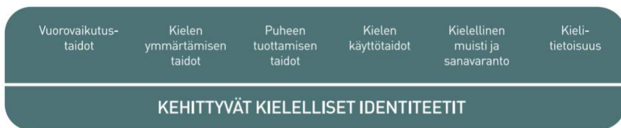
Kuvio 3. Lasten kielen kehityksen keskeiset osa-alueet varhaiskasvatuksessa

Kielen oppimisen kannalta on tärkeää tiedostaa, että saman ikäiset lapset voivat olla eri vaiheissa kielen kehityksen eri osa-alueilla. Kielelliset identiteetit kehittyvät , kun lapsia ohjataan ja tuetaan kielellisten taitojen ja valmiuksien keskeisillä osa-alueilla.