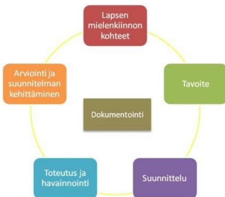
Kuva: Lähtökohtia arviointiin

Lasten kehittyminen ja oppiminen tehdään näkyväksi dokumentoinnin kautta. Dokumentointi on vahvasti mukana joka vaiheessa, mm. lasten mielipiteiden, kokemusten ja tuotosten muodossa. Monipuolista lasten kehittämisestä ja oppimisesta koottua tietoa käsitellään säännöllisesti sekä lasten että huoltajien kanssa. On tärkeää, että lapsi itse oppii havaitsemaan vahvuutensa ja edistymisensä ja että huoltajat voivat tukea lastaan.