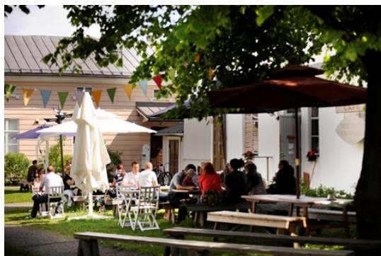
Bild: Direkt delaktighet bland unga på andra stadiet.