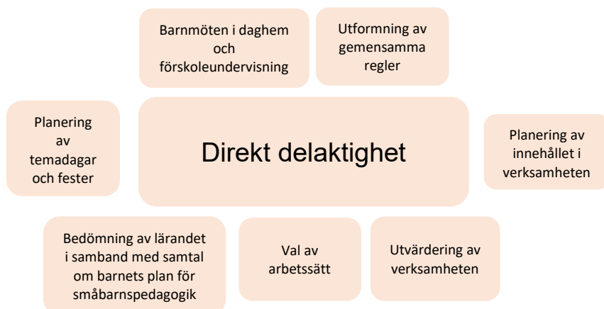
Bild: Direkt delaktighet i småbarnspedagogiken och förskoleundervisningen

Personalen inom småbarnspedagogiken berättar bland annat följande om praxis som främjar delaktigheten: