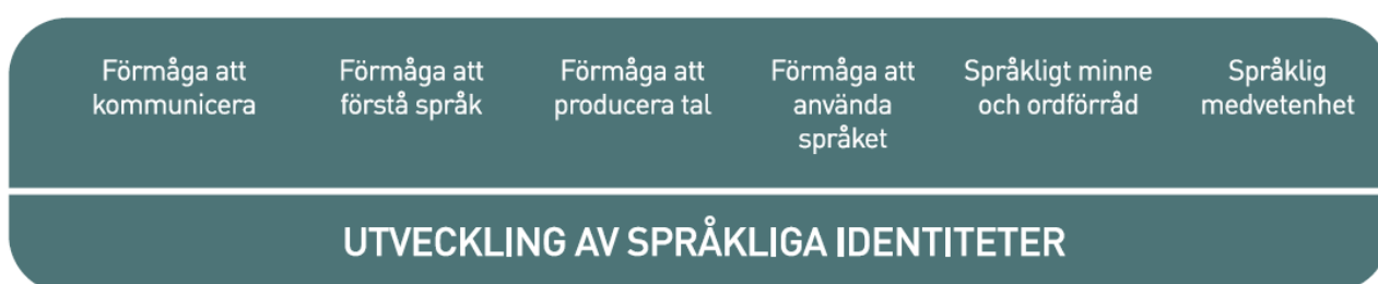
Figur 3. Språkutvecklingens centrala delområden inom småbarnspedagogiken

Med tanke på språkinläringen är det viktigt att vara medveten om att barn i samma ålder kan befinna sig i olika skeden av språkutvecklingen inom olika delområden. De språkliga identiteterna utvecklas när barnen får stöd och handledning inom de centrala delområdena för språkliga kunskaper och färdigheter.