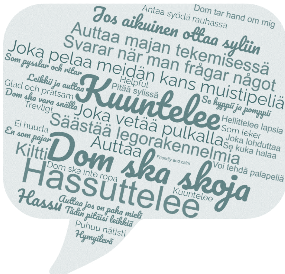
Bild 1. "Hurdan är en trevlig vuxen?" Barns svar i utvärderingen av den småbarnspedagogiska verksamheten 2022.

småbarnspedagogiska verksamheten och barnen ska ges mångsidiga möjligheter att delta och påverka så att alla får uppleva delaktighet och gemenskap.