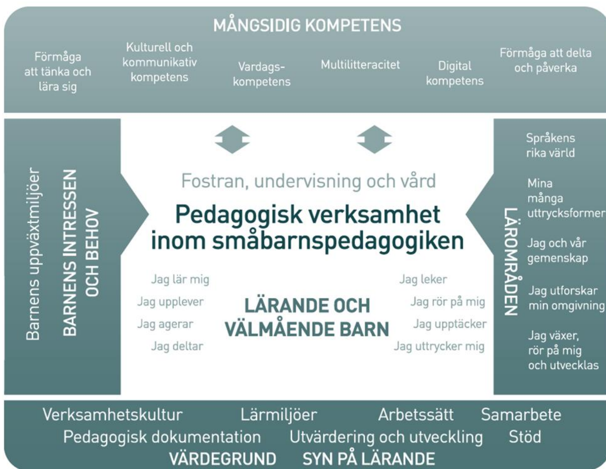
Figur 2. Referensram för den pedagogiska verksamheten inom småbarnspedagogiken

Den pedagogiska verksamheten inom småbarnspedagogiken ska präglas av ett helhetsskapande angreppssätt. Målet är att främja barnens lärande och välbefinnande samt mångsidiga kompetens (figur 2). Den pedagogiska verksamheten förverkligas i samverkan mellan barnen och personalen och i den gemensamma verksamheten. Barnens spontana verksamhet, personalens och barnens gemensamma idéer till verksamhet och verksamhet som planerats av personalen ska komplettera varandra. Den pedagogiska verksamheten inom småbarnspedagogiken ska genomsyra den helhet som består av fostran, undervisning och vård.