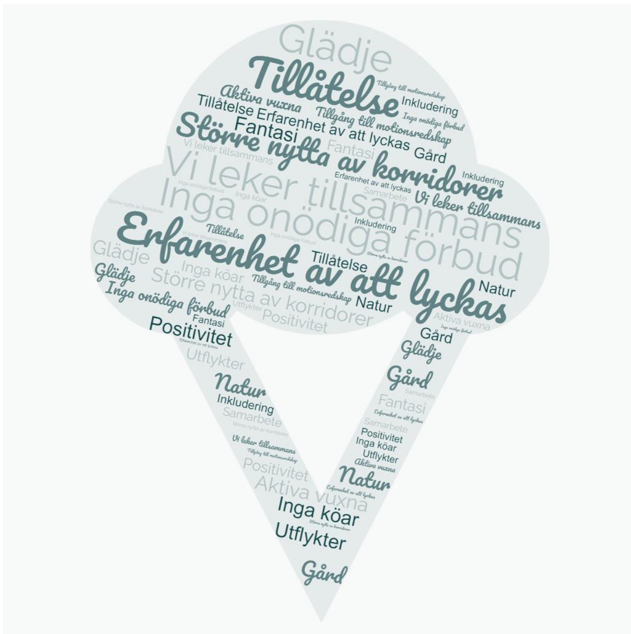
Bild 2. Karleby motionsansvarigas tankar om barncentrerad motionsfostran

Den närbelägna naturen, den byggda miljön och digitala miljöer erbjuder varierande lärmiljöer som utnyttjas regelbundet och planerligt. Det finns bra näridrottsplatser i Karleby och utnyttjandet av dem gör verksamheten inom småbarnspedagogiken mångsidigare. Samarbetet med lokala idrotts- och kulturaktörer berikar barnens lärmiljöer. Olika digitala applikationer och plattformar kan användas då lärområden tillämpas, i samarbetet med vårdnadshavarna och som verktyg vid dokumentationen av den pedagogiska verksamheten. Man bekantar sig med digitala verktyg och utnyttjar dem med beaktande av barnets ålder, behov och intressen. Vårdnadshavarna uppmuntras att stödja utvecklingen av barnets fysiska färdigheter genom att röra på sig tillsammans med barnet.