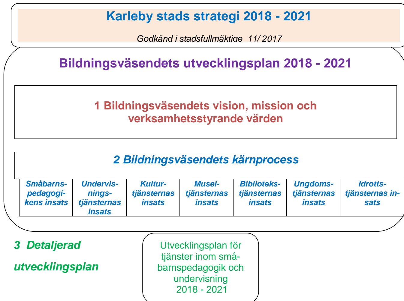
Figur 3: Strukturen för bildningsväsendets utvecklingsplan.

Kopplingen mellan stadsstrategin och bildningsväsendets utvecklingsplan presenteras i följande figur: