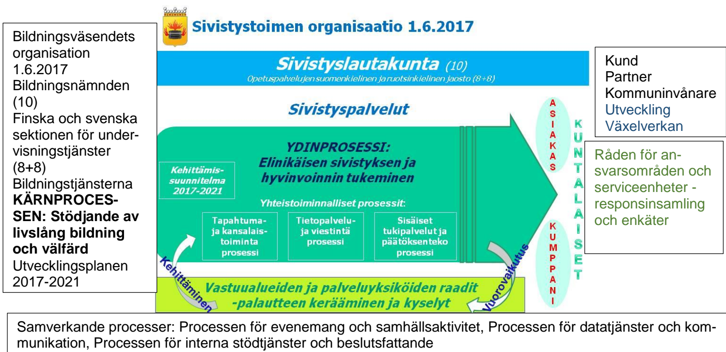
Figur 1: Bildningsväsendets organisation 2017 i form av processbeskrivning.

Bildningsväsendets organisation reformerades när den nya mandatperioden inleddes 1.6.2017. Organisationen presenteras med hjälp av kärnprocessen och tre samverkande processer. Bildningsväsendets förvaltning har organiserats enligt den nya modellen och verksamhetsreformen sträcker sig över hela mandatperioden.