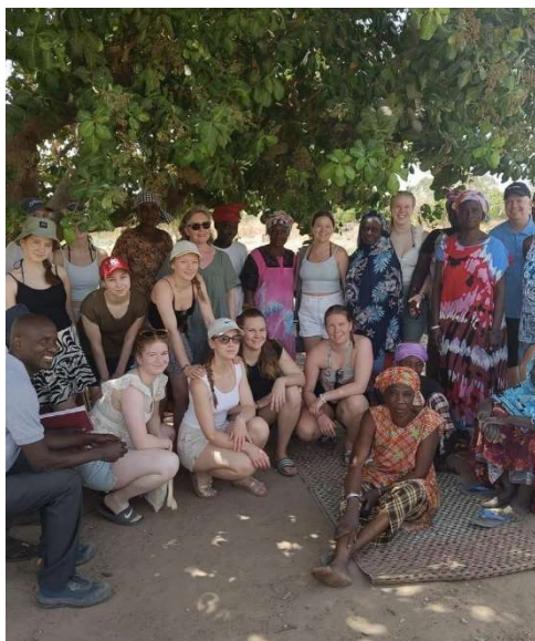
Projektresa till Fatick, Senegal 2024