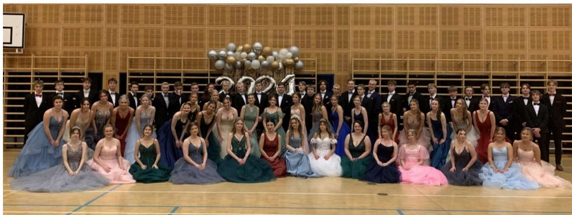
De gamlas dans 2024

De gamlas dag firas med en dansuppvisning i skolan på dagen och på kvällen gemensamt med de finska gymnasierna. Efter dansen i skolan samlas studerande och lärare till en gemensam kaffeservering. Det är önskvärt att alla tvåor deltar i de gamlas dag.