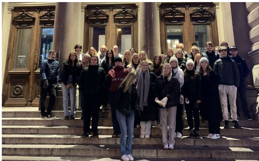
G21 utanför Ateneum i Helsingfors hösten 2023