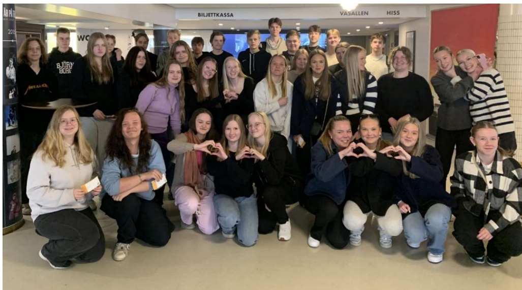
Grupp 23 på teaterbesök vid Wasa Teater våren 2024.