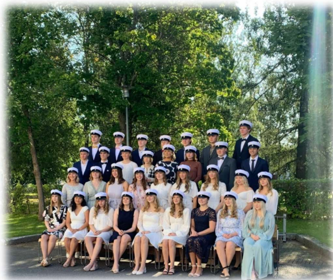
Studenter våren 2021