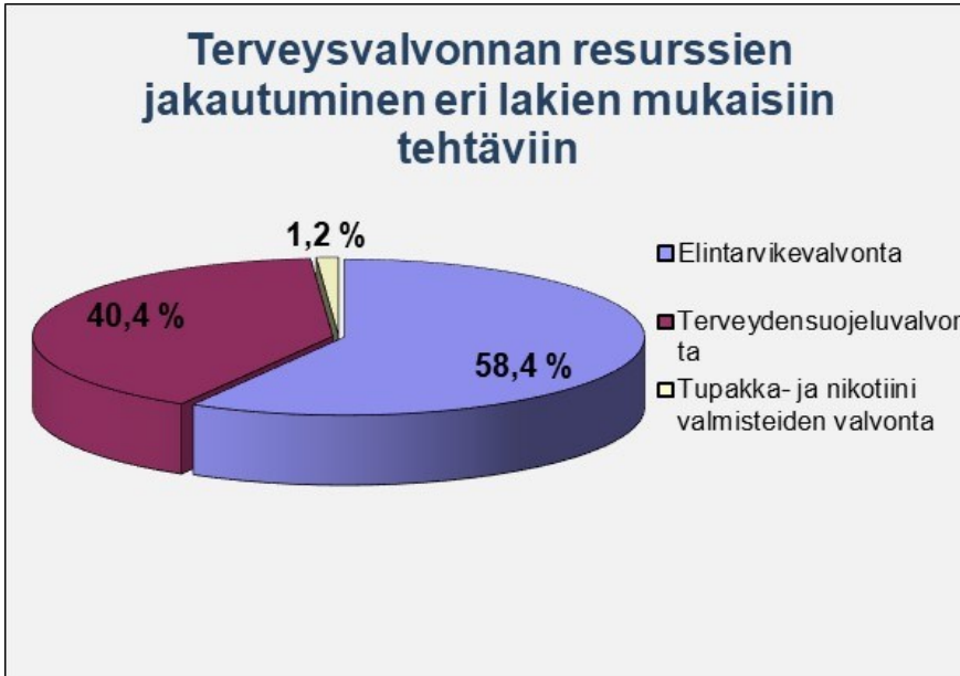
Kuva 1. Terveysvalvonnan resurssien jakautuminen