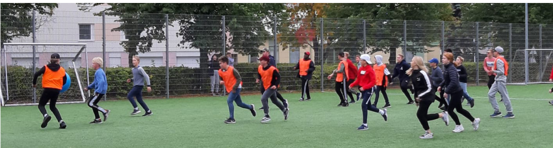
Väneleverna ordnar rastaktiviteter på skolan. Bland annat ordnade väneleverna turnering i elefantfotboll åt sjuorna.