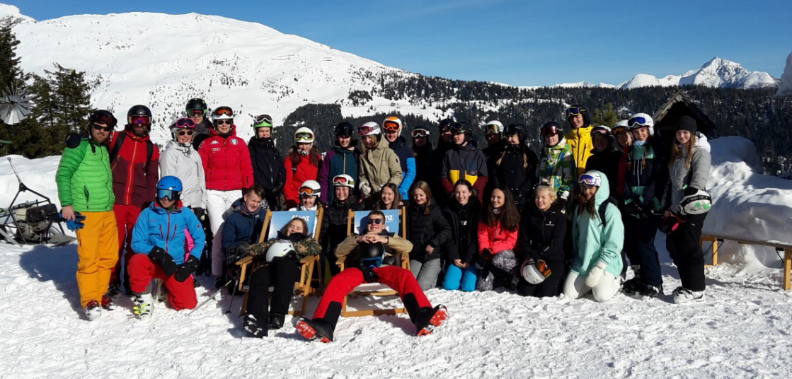
KSG i Lienz i januari 2020, friluftsdag med utförsåkning.