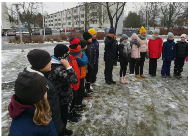
Folkhälsans "rasturang" besökte skolan och gav tips på lekar som eleverna kan leka under en rasterna.