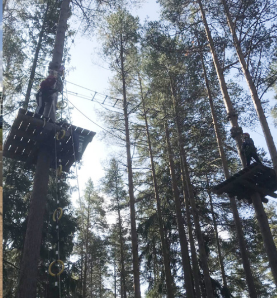
Eleverna i åk 6 på lägerskolan i Kalajoki, Olympiaden och besök till Pakka.

gerskola till Kalajoki. På onsdagsmorgonen var vi till Villa Elba och paddlade. Det var roligt och alla klarade sig torrskodda i land. Efter det åkte vi buss till Kalajoki och checkade in på SaniFani hotell och eleverna var nöjda med lägenheterna de fick bo i, 3-4 elever i varje.