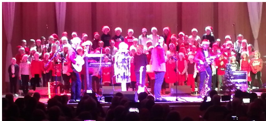
Julkonsert i Snellmanssalen tillsammans med Guns rosor.

sammans på iPads. Fyrorna har arbetat med deckare i modersmål; de har läst deckare och skrivit egna. Norden och dess länder har varit ett stort tema och alla elever fick göra ett större forskningsprojekt om var sitt nordiskt land.