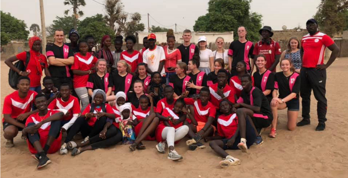
Projekt Bli Målmedveten i Senegal i februari 2020, fotbollsmatch Finland-Senegal 1-1.