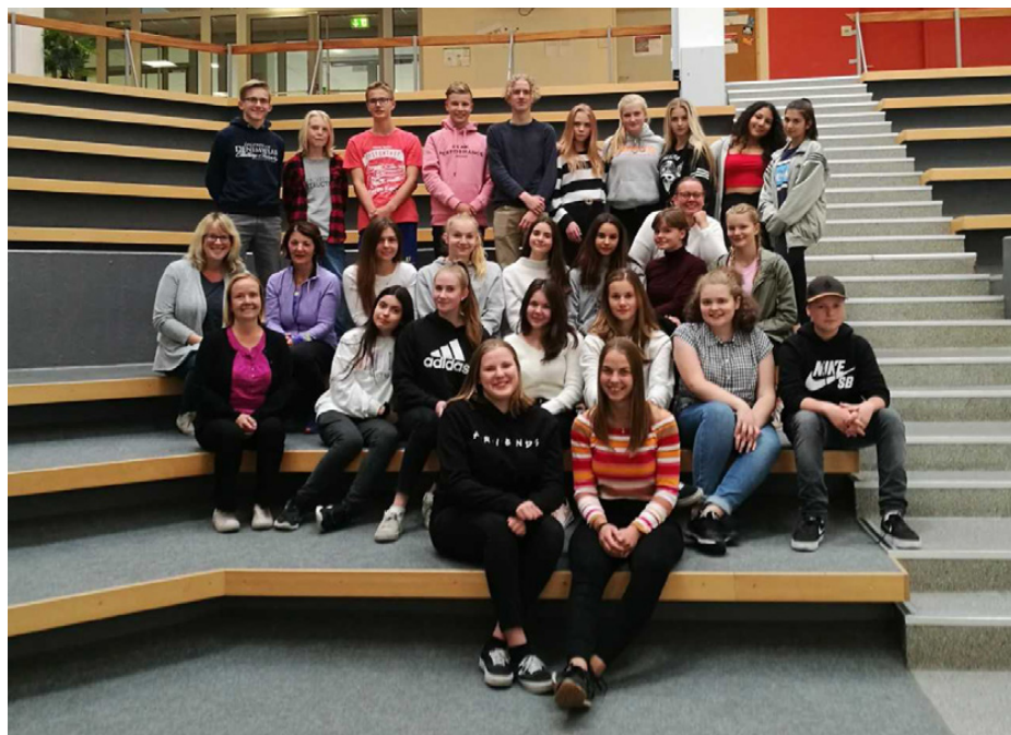
Ahnatal skolans elever tillsammans med våra elever.

mycket ifrån varandra. Liksom hos oss håller de t ex på med perspektivarbeten i bildkonsten och använder moderna undervisningsmetoder som 3D-printer i matematiken, för att nämna något. Vi fick nya och användbara intryck och tips från de olika lektionerna vi besökte och vi fick även dela med oss hur vi gör det här i Karlaby. Vi hade flera givande och intressanta samtal med lärarna och rektorerna.