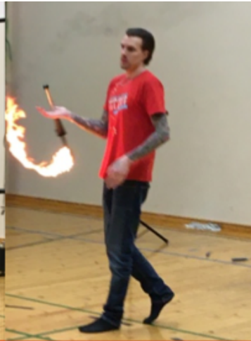
Till sist jonglerade han med brinnande facklor.

droppar och sattes upp i skolans aula. Vi har nu två hinkar och en massa vattendroppar med olika positiva budskap som möter alla som kommer in genom skolans dörrar.