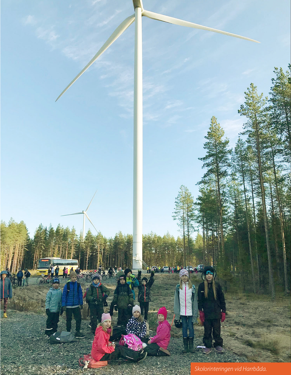
Skolorinteringen vid Harrbåda.