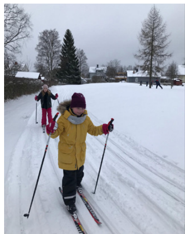
Eleverna har hunnit skida på gymnastiklektionerna.

gick obesegrade genom hela turneringen och stod som slutsegrare efter finalmatchen. Tyvärr blev det inga skidtävlingar i år på grund av snöbristen, men eleverna har ändå skida några gånger under gymnastiklektionerna. Flera klasser har gjort besök har gjorts till bowlinghallen och Sandhagens idrottsområde har ofta besökts. Simundervisning har eleverna fått fem gånger per termin och åk 6 har fått livräddningsträning.