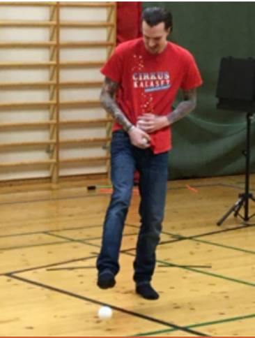
Han jonglerade som flera djur t.ex. elefant och ett lejon och andra djur.