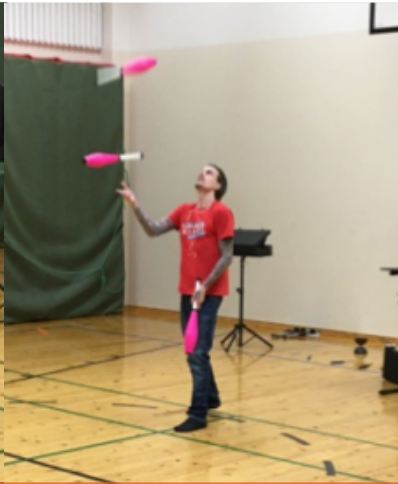
Han har använt käglor i 7 år.