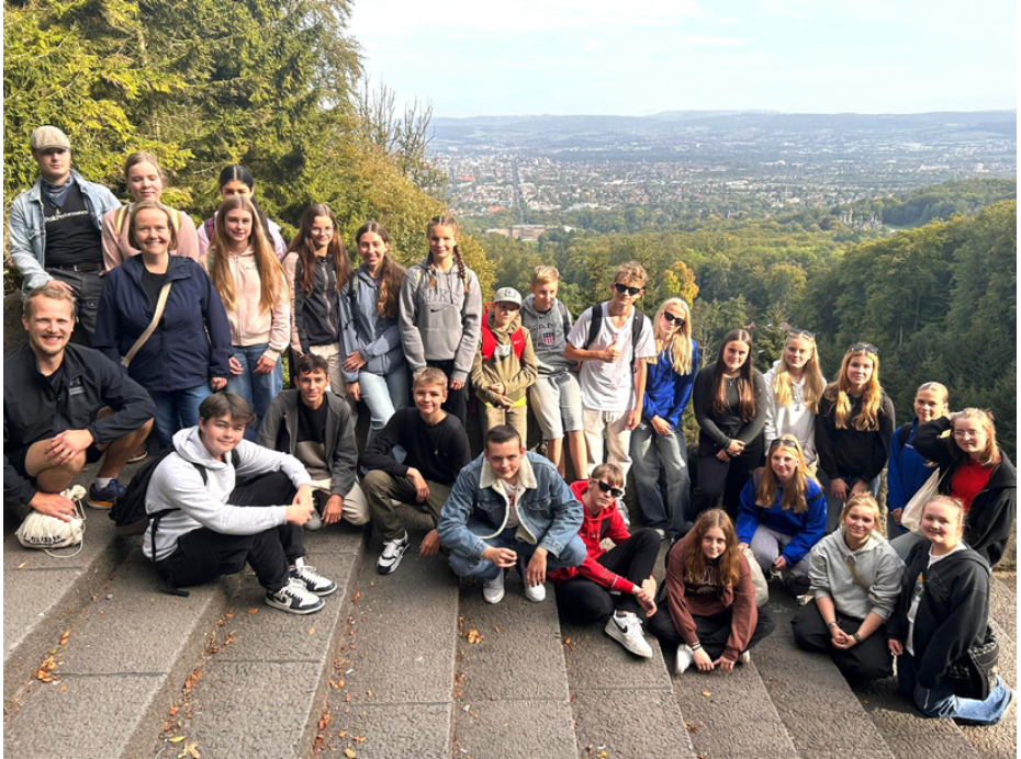
Våra elever tillsammans med sina värdar i Kassel i bergparken Wilhelmshöhe.