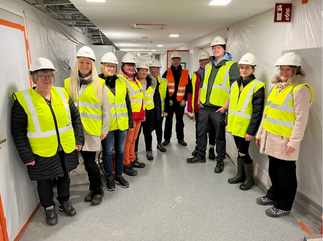
Personalen var nöjd över att kunna besöka Banérgatan och se hur projektet framskrider.

under medeltalet. Utmaningen i läsningen visade sig vara våra pojkar som gjorde bottennotering i läsningen, och kom långt under de finländska pojkarnas medeltal.