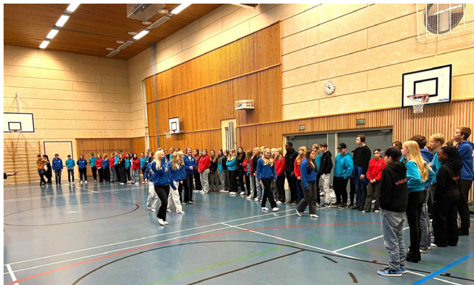
Regionens vänelever samlade för en gemensam utbildning.