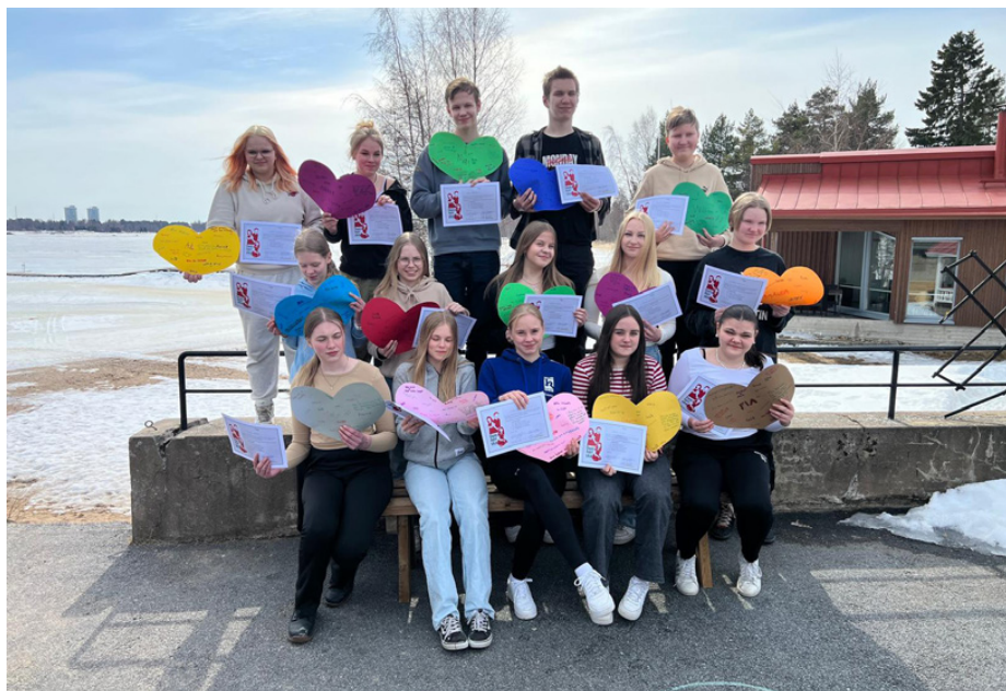
Donnerska skolans vänelever fotograferade på vänelevsutbildningen maj 2023.

När höstterminen kör igång välkomnar väneleverna de nya sjuorna och hjälper dem till rätta i skolan. Väneleverna har egna sjuor att ta hand om, och deltar under hösten på en av deras elevhandledningstimmar, samt är med till Vinge när den klassen har teambyggardagar där. Under året ordnar väneleverna olika rastaktiviteter och program för eleverna i skolan, för att öka trivsel och positiv skolanda. Sådana evenemang ordnades