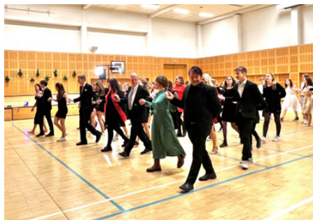
Polonäsen var populär särskilt bland niorna.