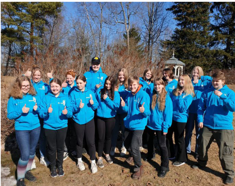
Årets vänelever fotograferade i april 2022

klasserna göra olika övningar, leka olika lekar och bara lära känna varandra. Vänelevernas uppgift va att delta i övningarna, vara sociala och lära känna klassen och hjälpa dem att lära känna varandra.