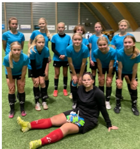
Donnerska skolans flicklag i fotboll.

Donnerska skolans fotbollspojkar tog sig till den österbottniska finalturneringen som spelades i Jakobstad, Tellushallen. Efter jämna kamper blev det slutligen en bronsmedalj för killarna.