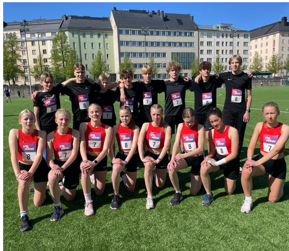
En del av våra löpare i stafettkarnevalen.

I masstafetten sprang alla flickor väldigt fint och lyckades med växlingarna vilket resulterade i en fin 7:e plats.