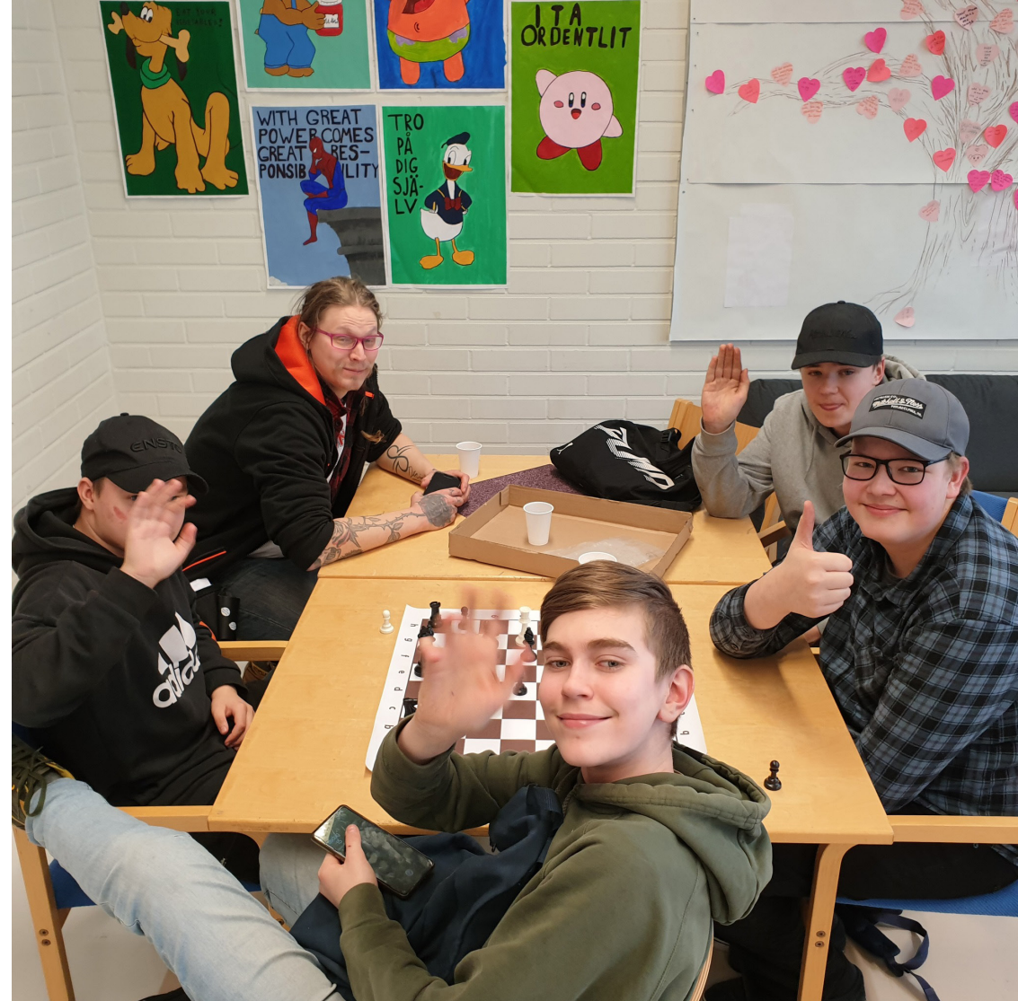
Hos skolcoachen kan man bli spela schack på rasterna.