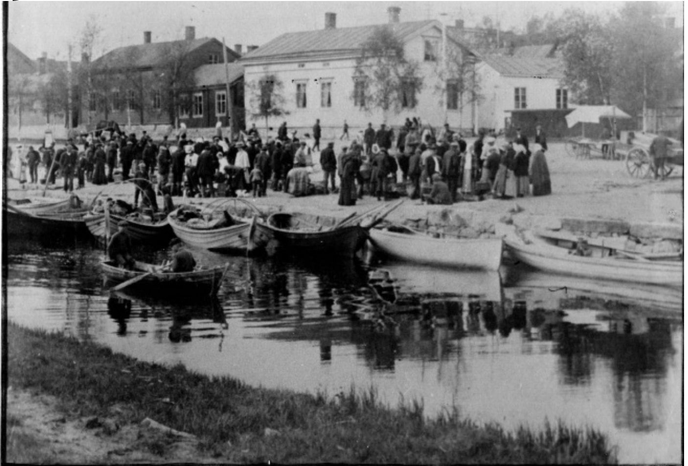
“FISKSTRANDEN” PÅ 1890-TALET

FÖRSÖK HITTA FRAM TILL DENNA PLATS, SOM FINNS NÅGONSTANS I KARLEBYS CENTRUM. STÄLL DIG DÄR DETTA GAMLA FOTOGRAFI ÄR TAGET.