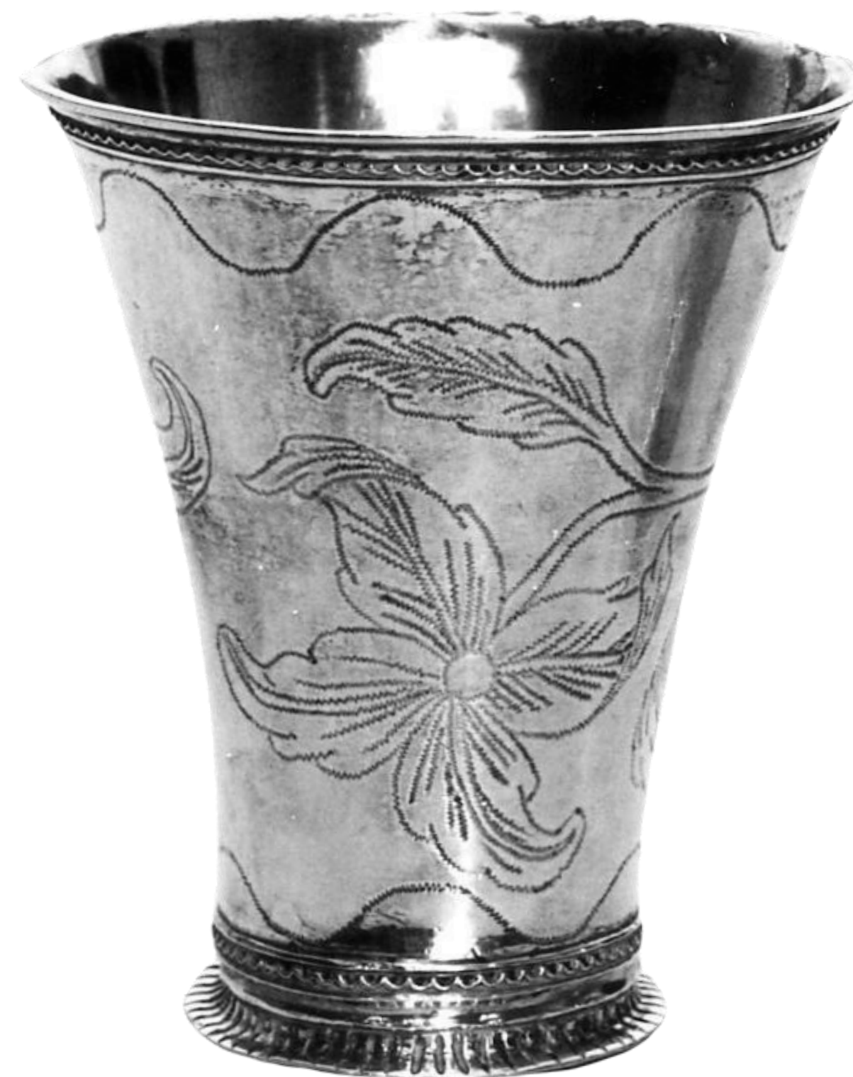
Edgrénin valmistama hopeinen pikari vuodelta 1767, Kansallisgallerian kokoelmissa.