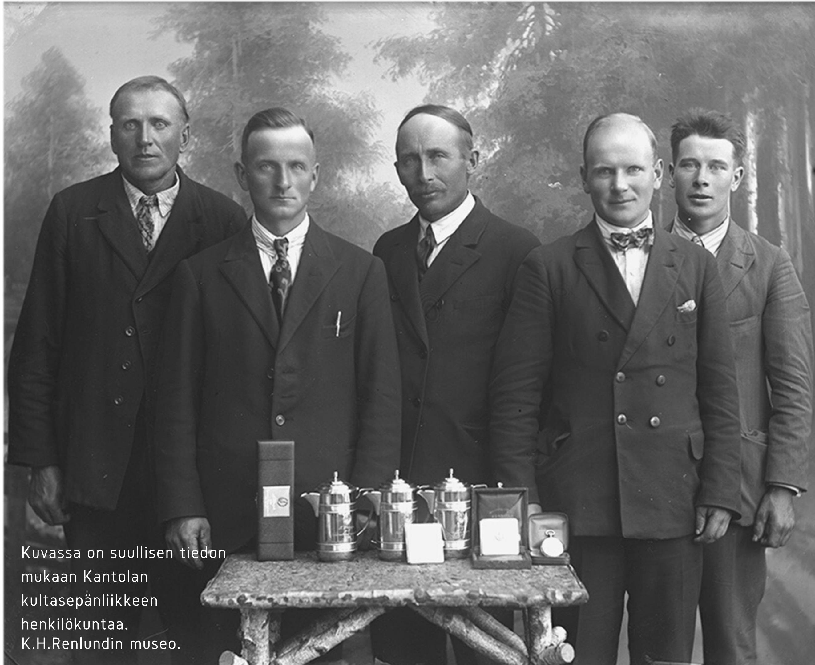
Kuvassa on suullisen tiedon mukaan Kantolan kultasepänliikkeen henkilökuntaa.