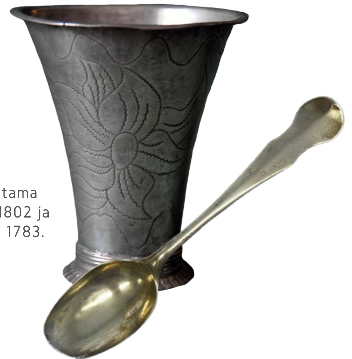
Michel Chorinin valmistama hopeapikari vuodelta 1802 ja hopealusikka vuodelta 1783. K.H.Renlundin museo

Vuoteen 1802 saakka hänellä oli yksi oppipoika, ja sen jälkeen kaksi. 1811 hän oli velkaa neljännesvuosirahat vuosilta 1804–1810.