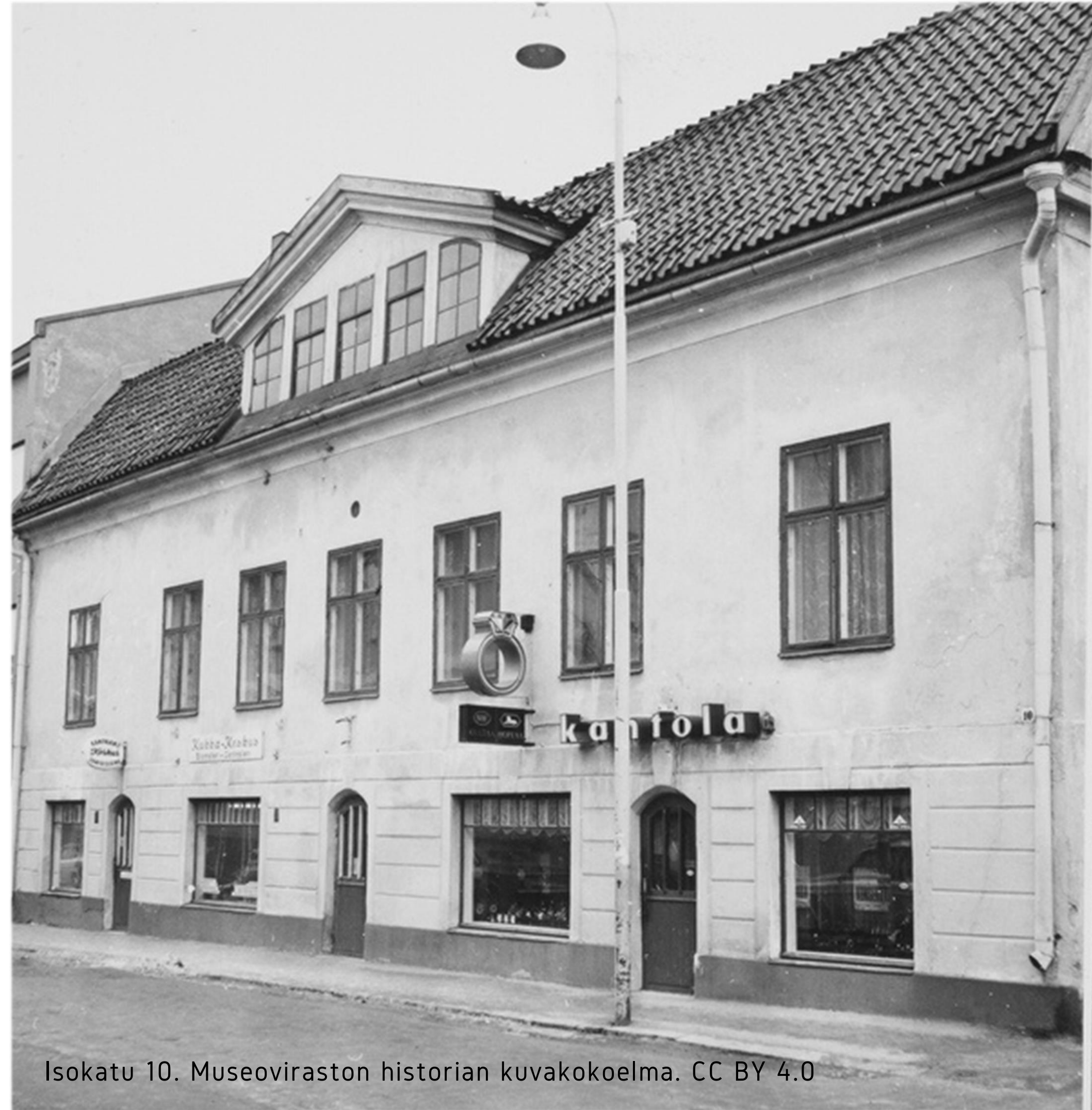
Isokatu 10.