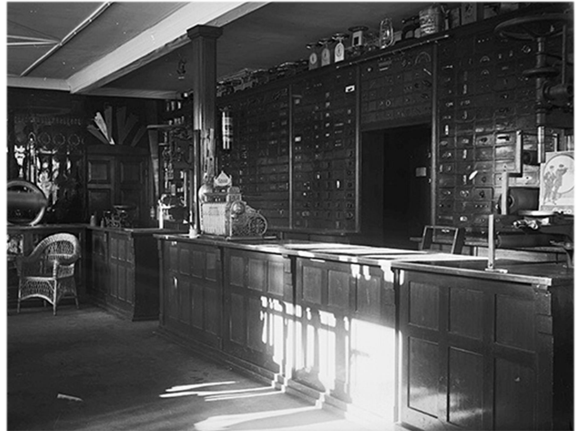
Björklunds järnhandel 1923.