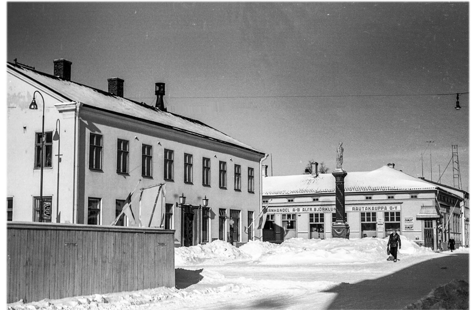
Björklunds järnhandel år 1957 vid norra kanten av nuvarande Mannerheimplatsen.