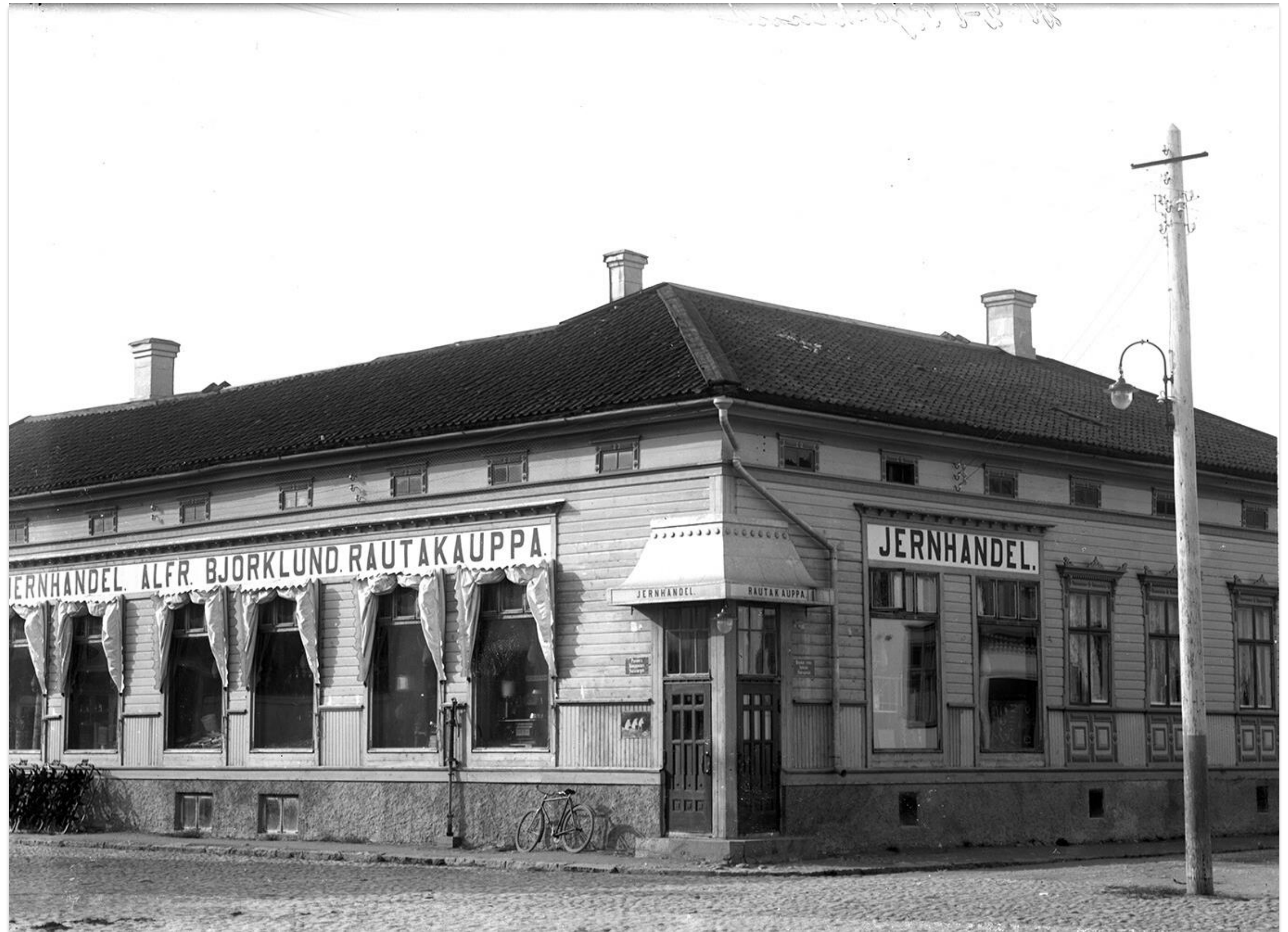
Björklunds järnhandel. K.H.Renlunds museum.