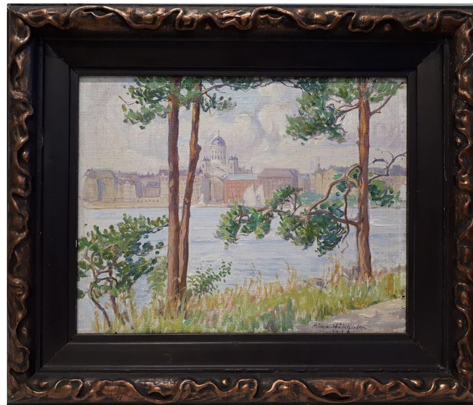
Vy från Tjärholmen (Helsingfors), 1926, K.H.Renlunds museum