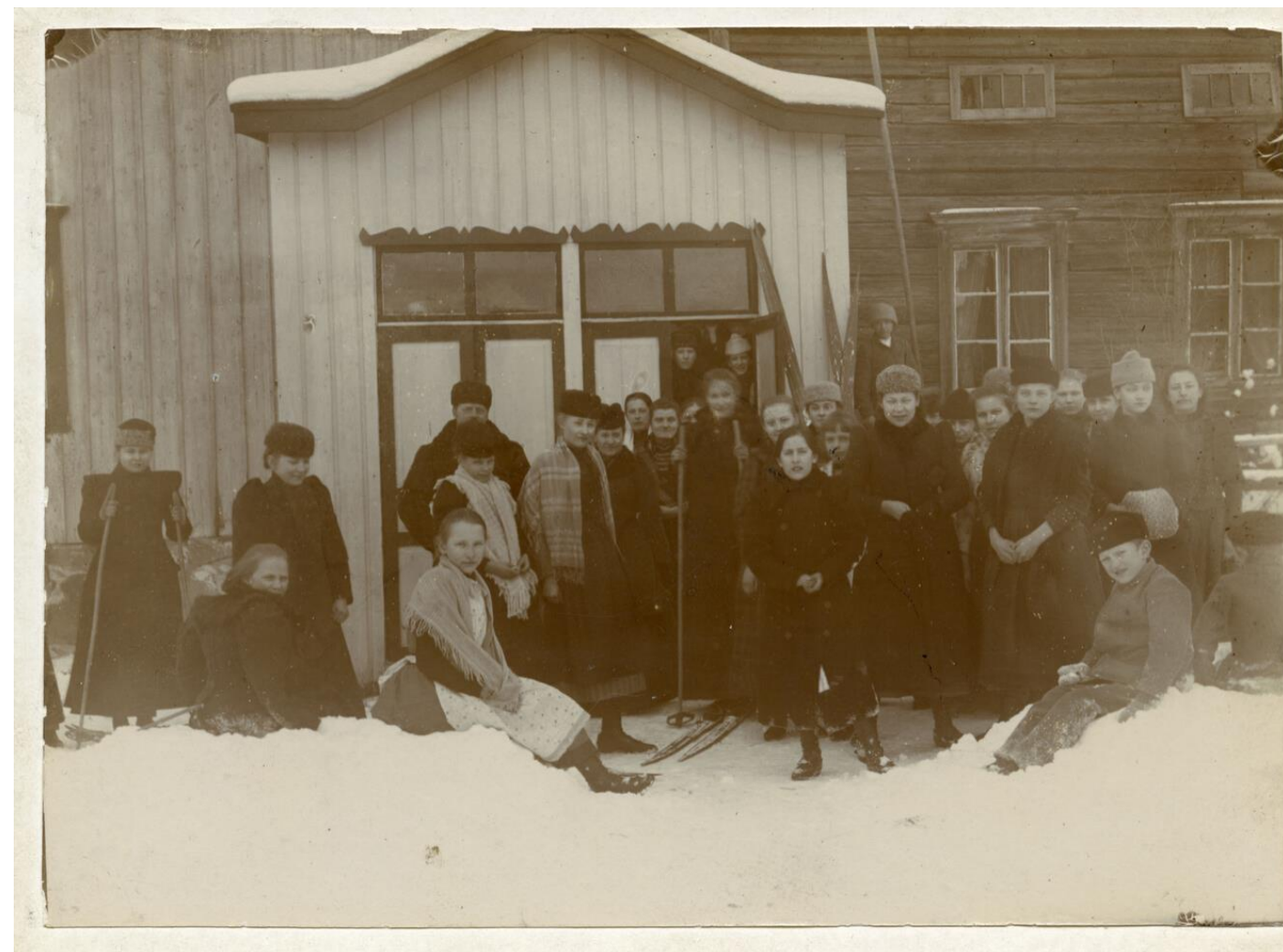
Fruntimmersskola i Gamlakarleby, 1894. K.H.Renlunds museum.