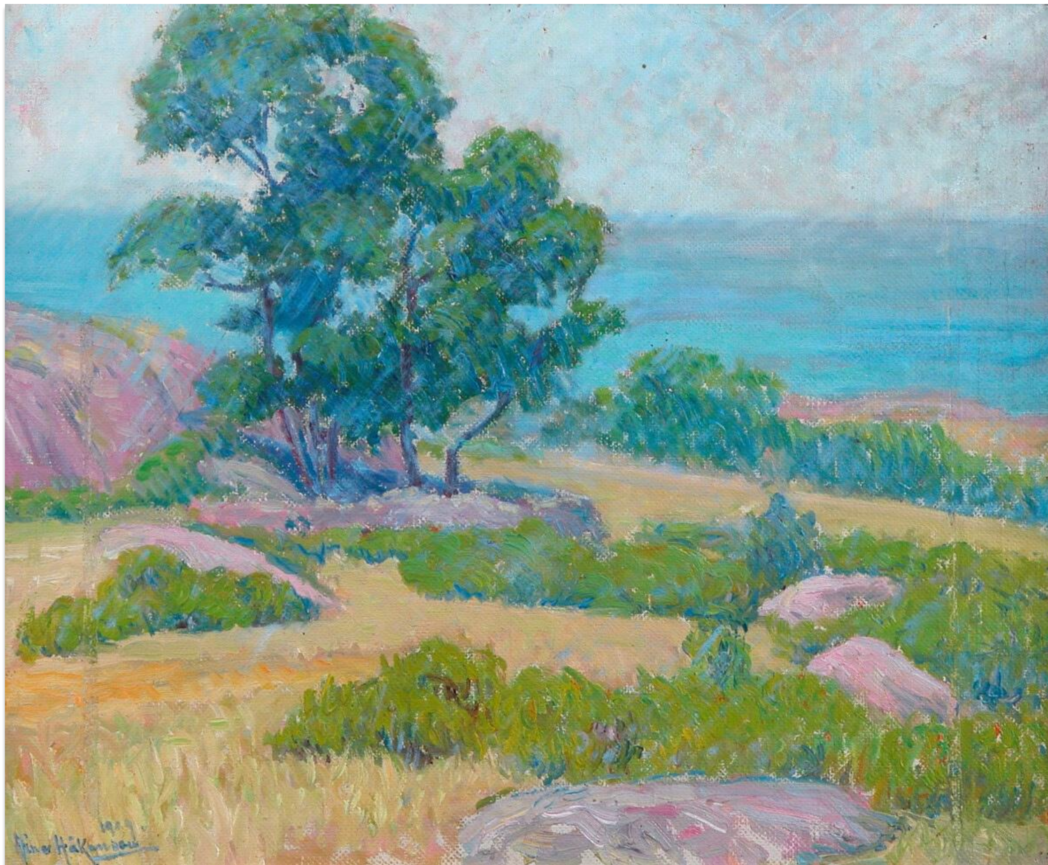
Aina Håkansson: Strandvy, 1909, K.H.Renlunds museum.