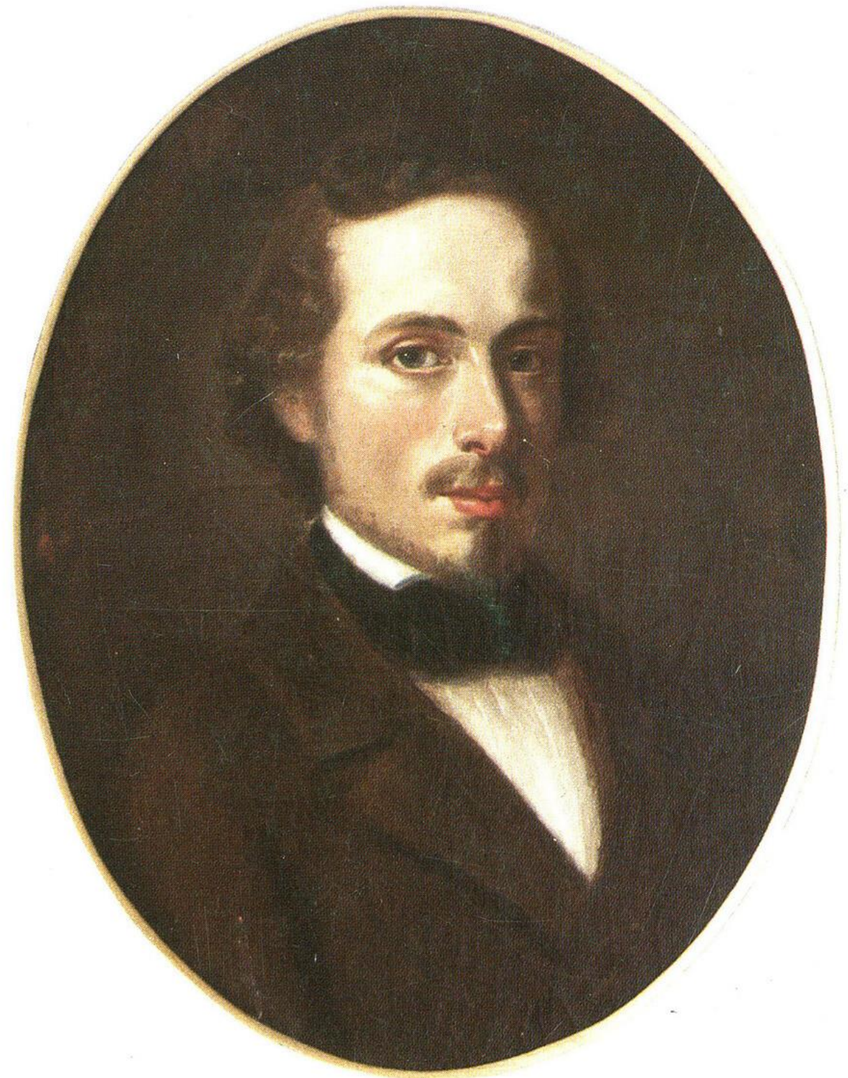
Olivia Kyntzells målning av Conrad Sovelius. 1870-talet. K.H.Renlunds museum.