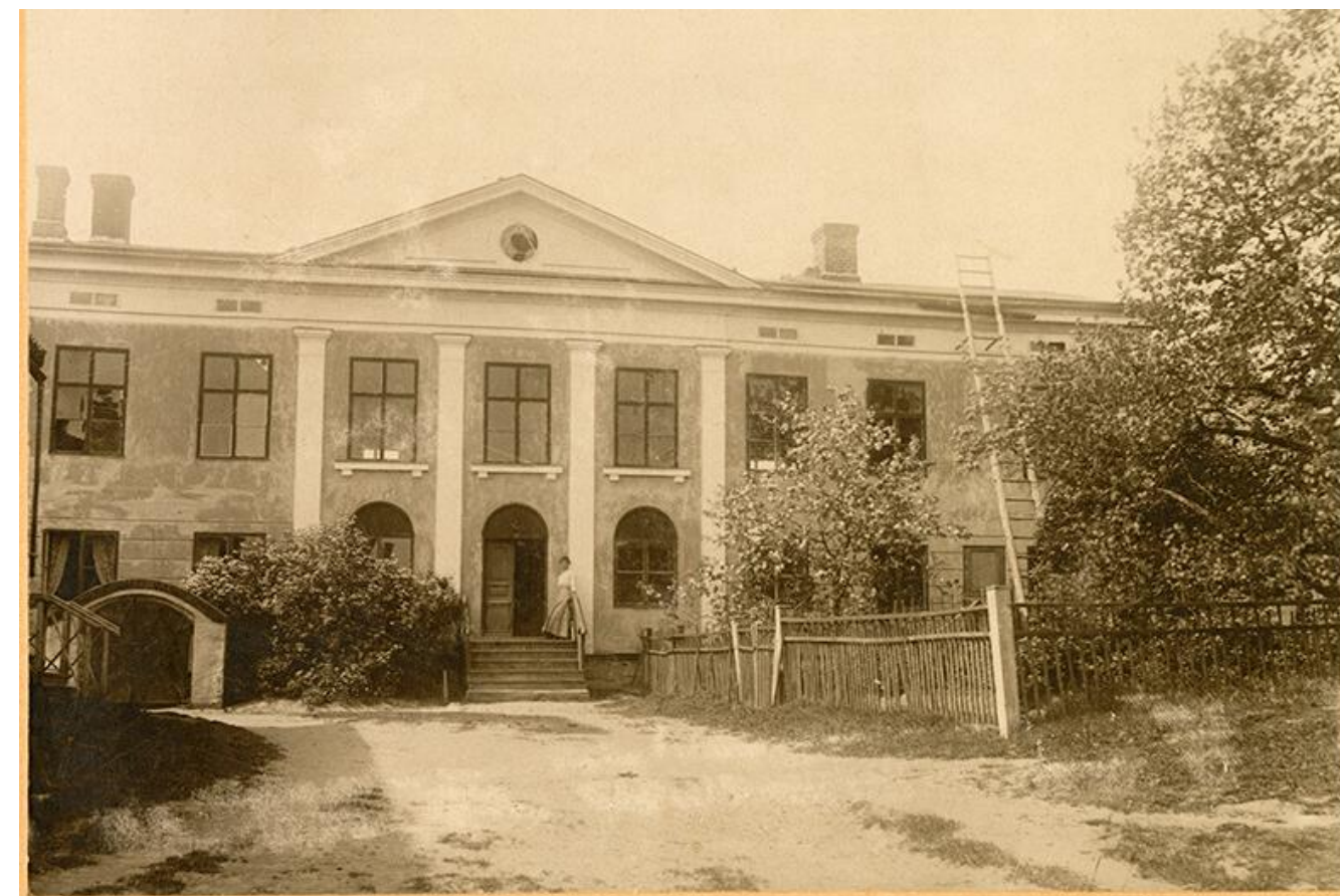
Boehmska huset 1918.

Skolan hade två klasser och vanligen ett tjugotal elever. Kyntzell var föreståndarinna fram till 1884. Skolan verkade till 1896. Från 1874 tjänstgjorde hon också som teckningslärarinna i primärskolan samt från 1884 också som lärarinna i stilskrivning.