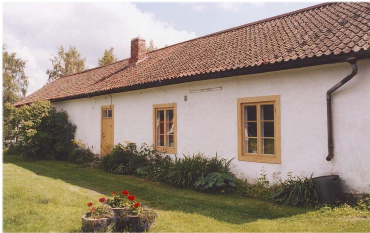
Ekonomibyggnaden i tegel vid Karleby prästgård.

Kyrkoherden lät år 1775 bygga en ekonomibyggnad med tegelstomme vid Karleby prästgård. Utvidgningen av Karleby kyrka hade planerats sedan 1760-talet men den färdigställdes först 1789. Det är möjligt att man i projektet med ekonomibyggnaden bekantade sig med det nya materialet, teglet, inför utvidgningen av kyrkan.