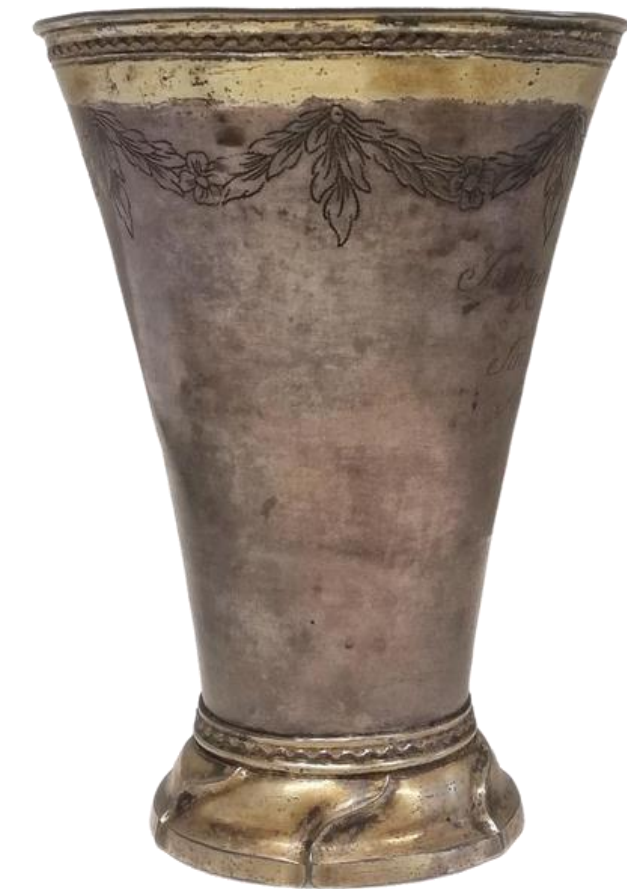
Rasmus pokal (privat ägo)