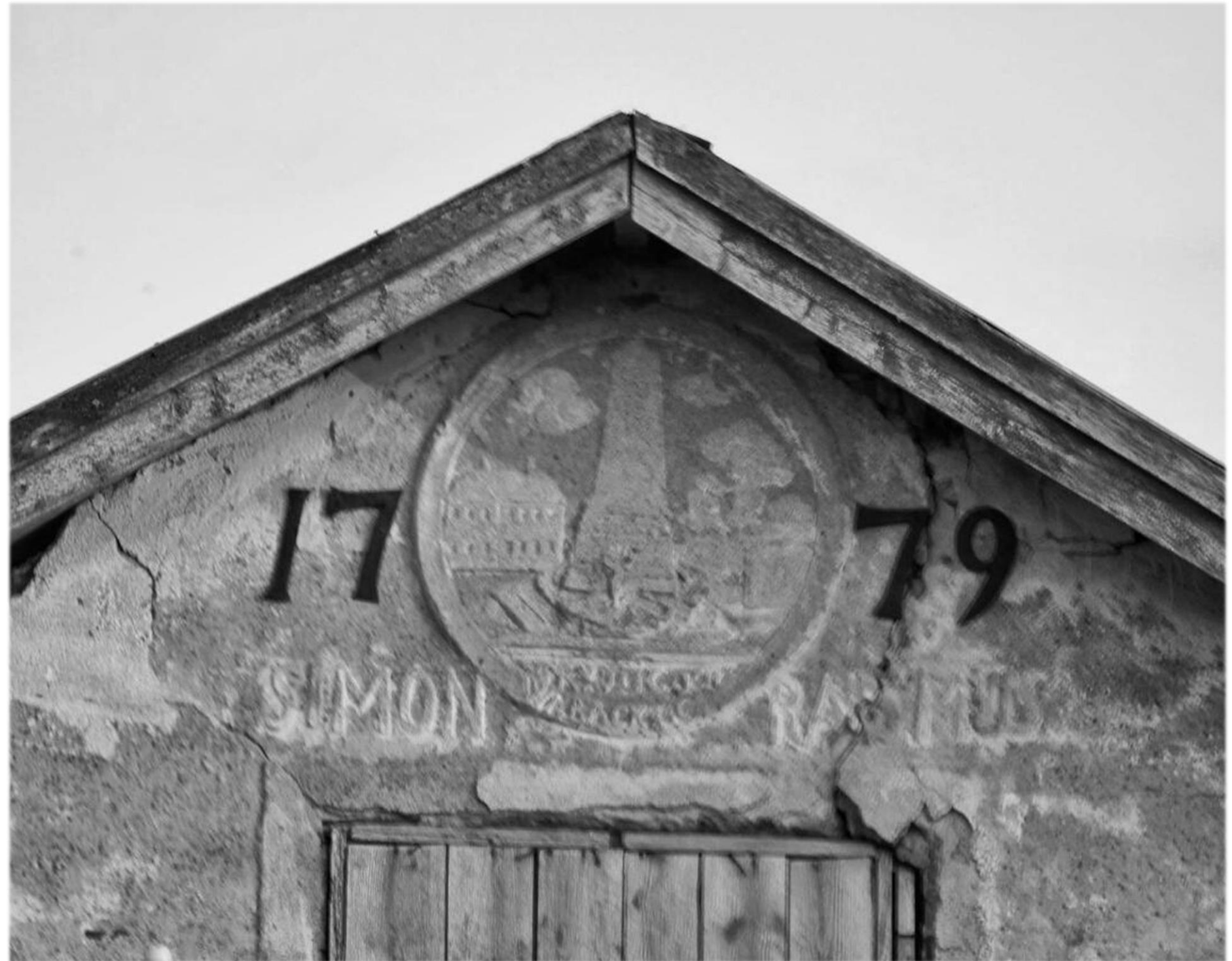
Simon Rasmus tegelhus gavel år 2019.