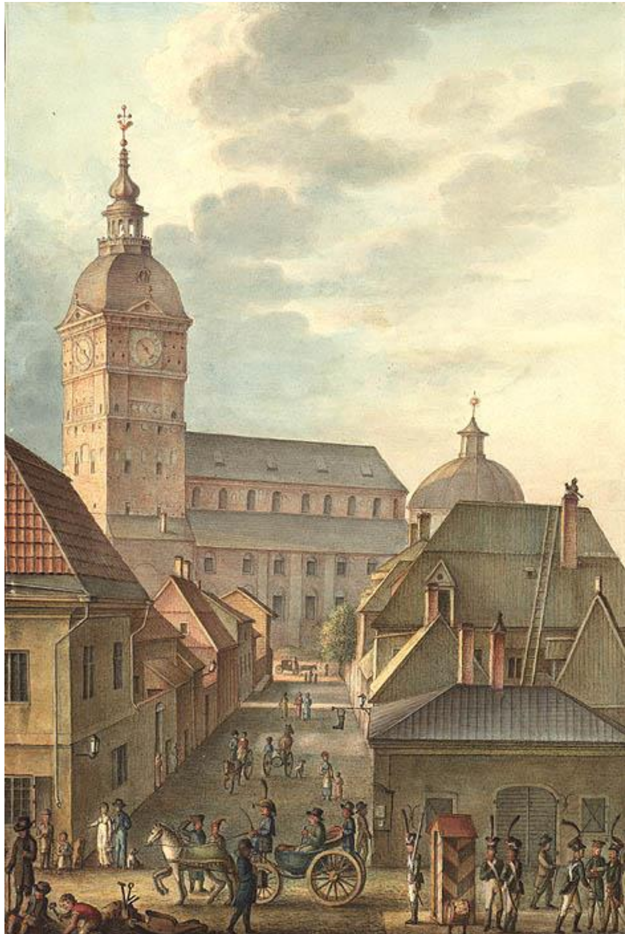
C.L. Engelin akvarelli Turun Tuomiokirkosta 1814.

Jacob Tengström haaveili runoilijan urasta siirtyessään kotiopetuksesta Vaasan trivi-aalikouluun. Kyvykkyytensä, uurastuksensa ja sukulaistensa tuen ansiosta Tengström hyväksyttiin alle 16-vuotiaana Turun akatemiaan. Pikkukaupungin kasvatille pääsy pääkaupunkiin oli merkittävä virstanpylväs jo sinällään.