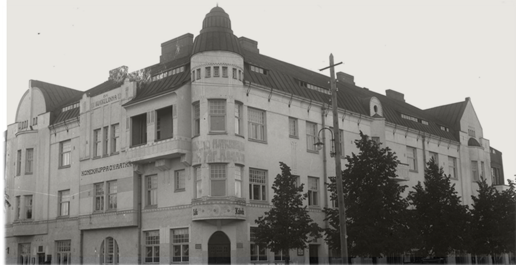
Pohjanpalot rakennuttivat Kokkolinnan, Kokkolan ensimmäisen monikerroksisen asuintalon 1908.

Pohjanpalot olivat mukana monessa, kuten Kokkolan Suomalaiset -yhdistyksen, Keski-Pohjanmaan Osuuskaupan, Kokkolan Kirjapaino Oy:n perustaman Kokkola-lehden sekä Keski-Pohjanmaan maanviljelysseuran alkuvaiheissa.