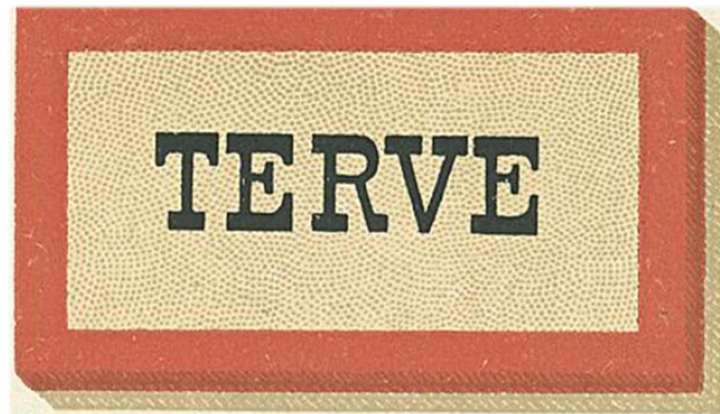
Eteismatto Suomen Köysitehtaan luettelosta 1911.