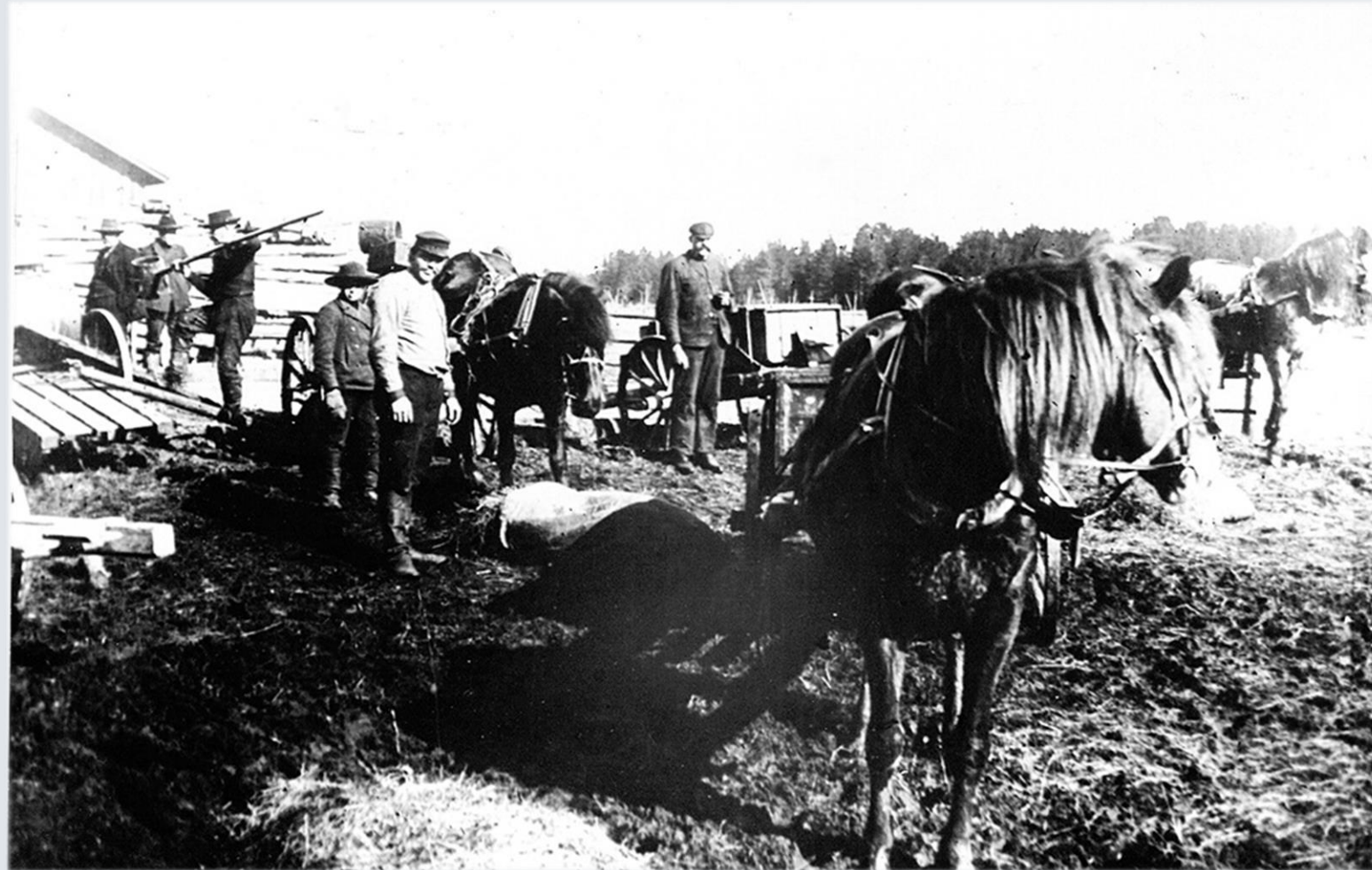
Rankkia hakemassa. Vi Neristassbor rf.