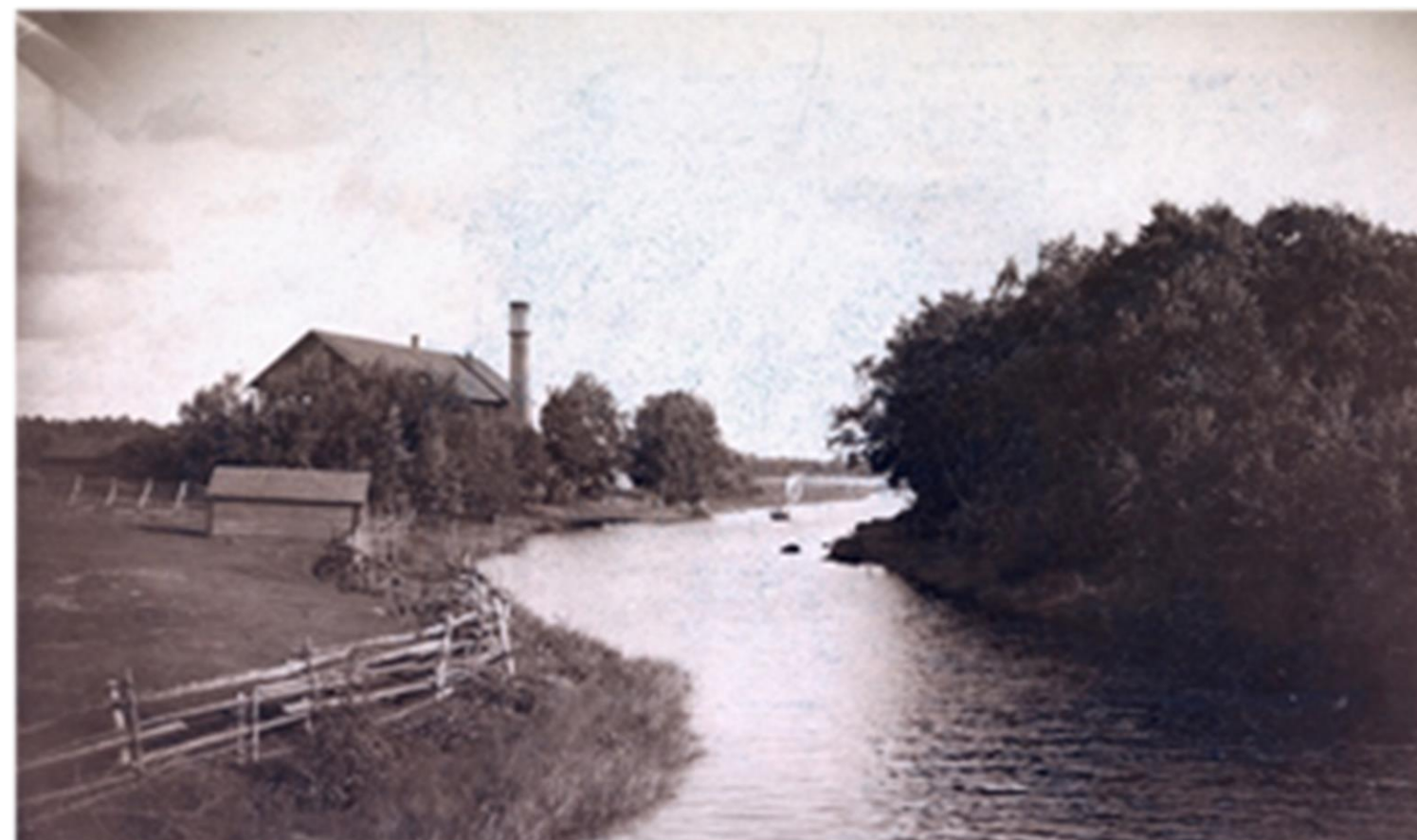
Vanha viinanpolttimo. Vi Neristassbor rf, Kokkolan kotiseutuarkisto.

Kerrotaan, että Forsén sai erikois-oikeuden myös liköörin, hajuvesien ja muiden spriistä jalostettujen tuotteiden valmistamiseen.