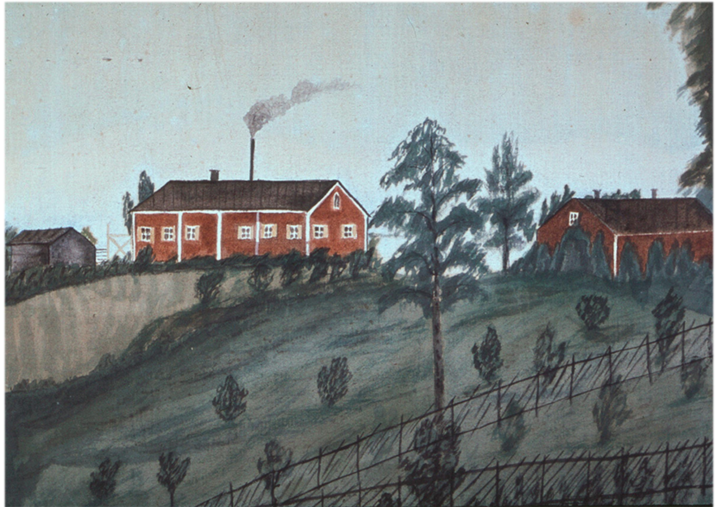
Conrad Soveliuksen maalaus viinanpolttimosta.