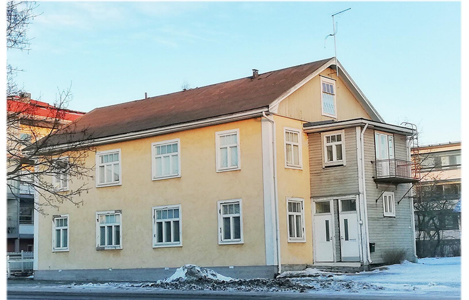
Kaarlelankatu 38 vuonna 2019.