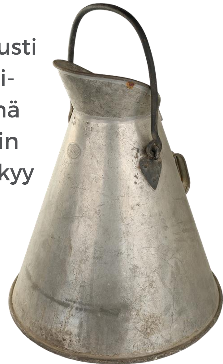
Viinamitta, käytetty todennäköisesti jossain Kokkolan viinanpolttimoista. K.H.Renlundin museo.