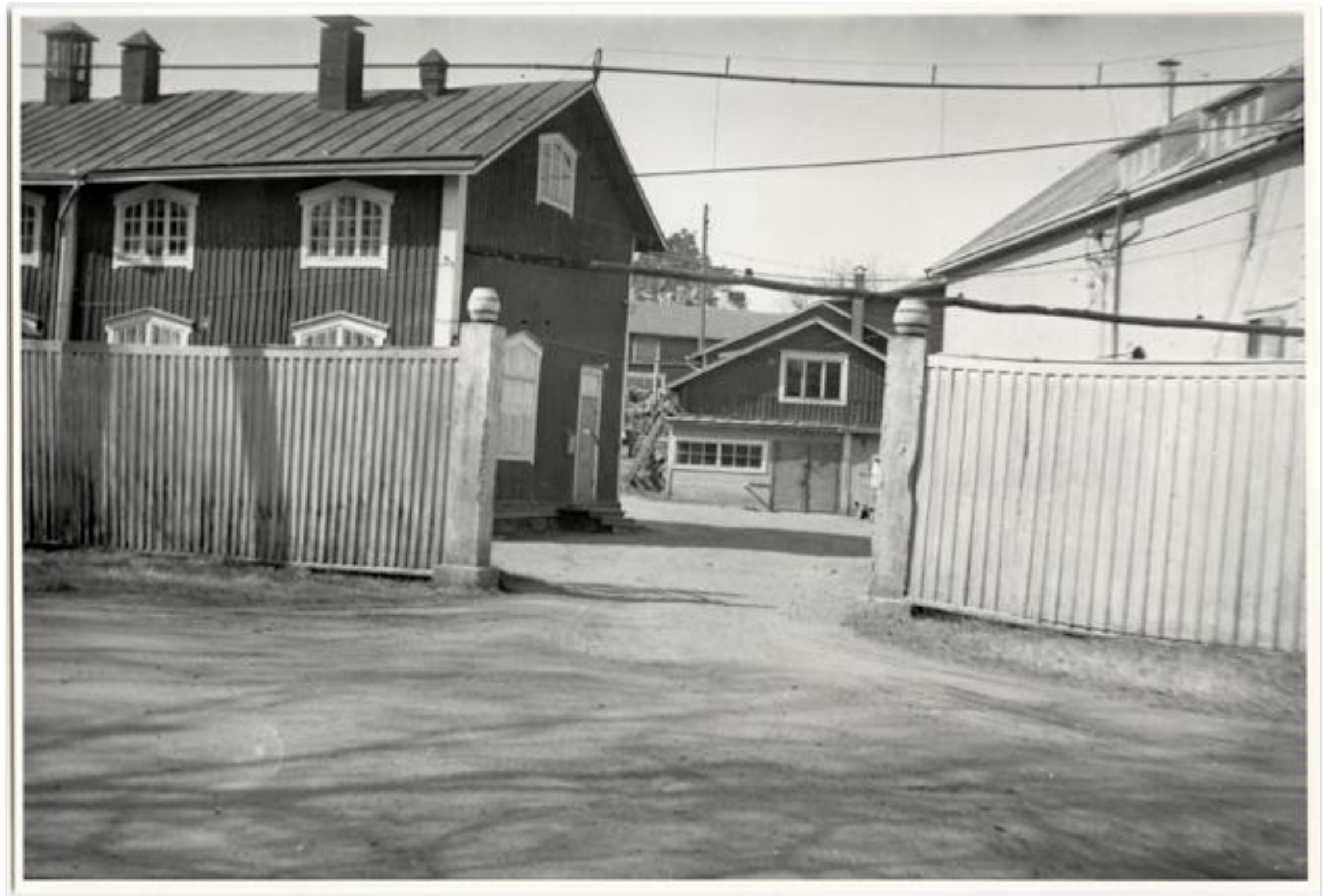
Kokkolan Panimon rakennuksia Kolumäellä portilta nähtynä. Vasemmalla itse panimo, perällä mm. jääkellari säilytystä varten. Oikealla uudempi jääkellari säilytystiloineen.