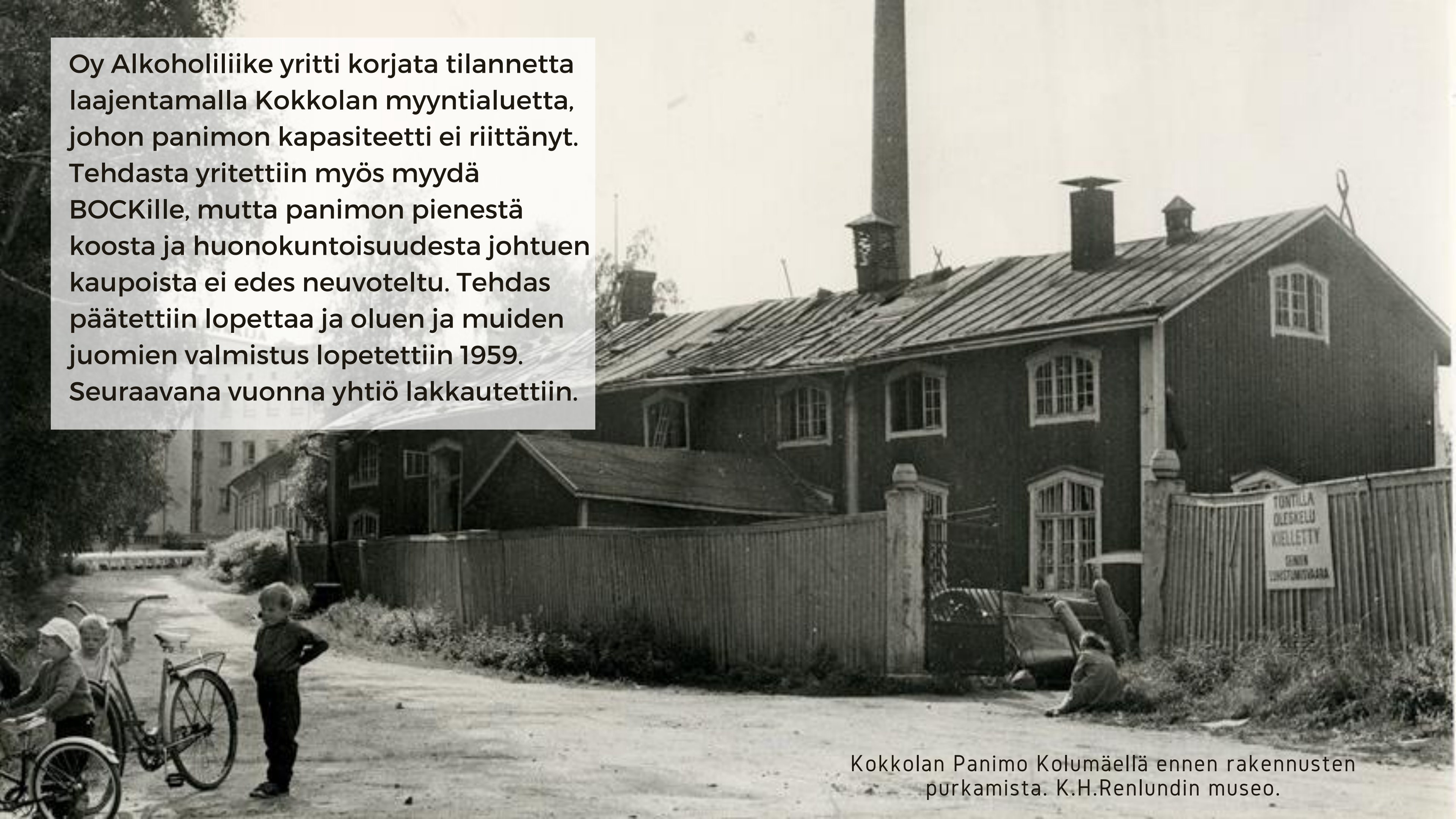
Kokkolan Panimo Kolumäellä ennen rakennusten purkamista. K.H.Renlundin museo.

Oy Alkoholiliike yritti korjata tilannetta laajentamalla Kokkolan myyntialuetta, johon panimon kapasiteetti ei riittänyt. Tehdasta yritettiin myös myydä BOCKille, mutta panimon pienestä koosta ja huonokuntoisuudesta johtuen kaupoista ei edes neuvoteltu. Tehdas päätettiin lopettaa ja oluen ja muiden juomien valmistus lopetettiin 1959. Seuraavana vuonna yhtiö lakkautettiin.