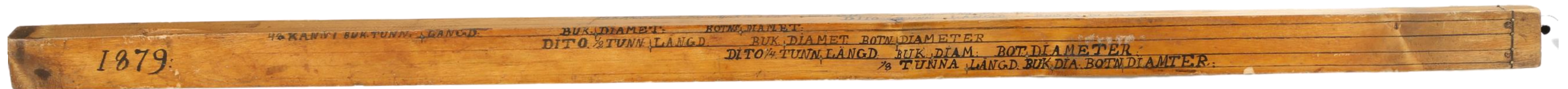
Mittakeppi, käytetty tynnyreiden ja astioiden sisämittojen/tilavuuden mittaukseen Kokkolan vanhassa viinapolttimossa. K.H.Renlundin museo.