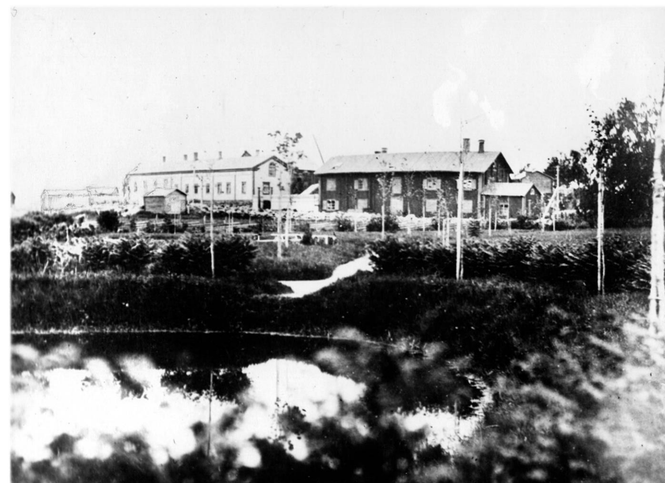
Panimo ja Länsipuiston "potti". Kuvatietojen mukaan 1870-luvulta.