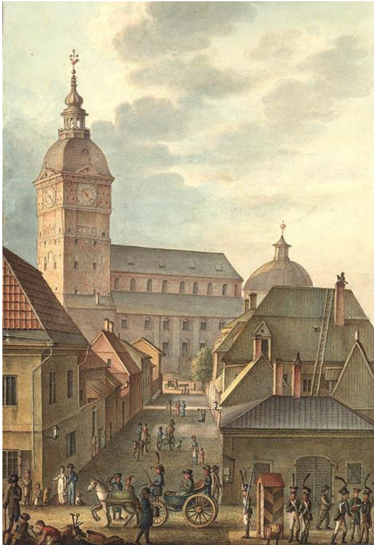
C.L. Engels akvarell föreställande Åbo Domkyrka 1814.