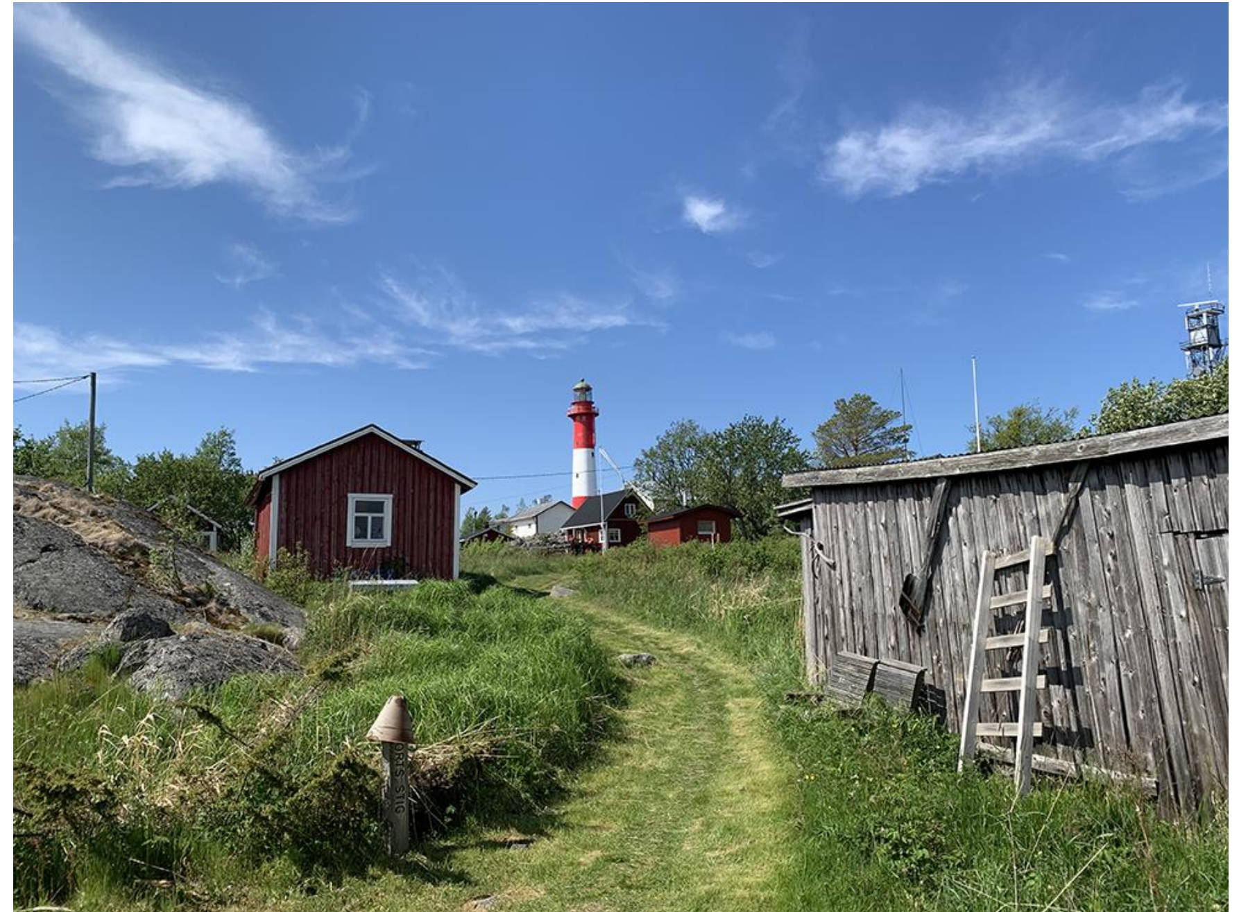
Ön Tankas och dess fiskarsamhälle blev bekant för naturintresserade Jacob Tengström senast under 1770-talet.

Jacob Tengström – uttag ur dikten “Renön”, också med namnet “Tankar”.