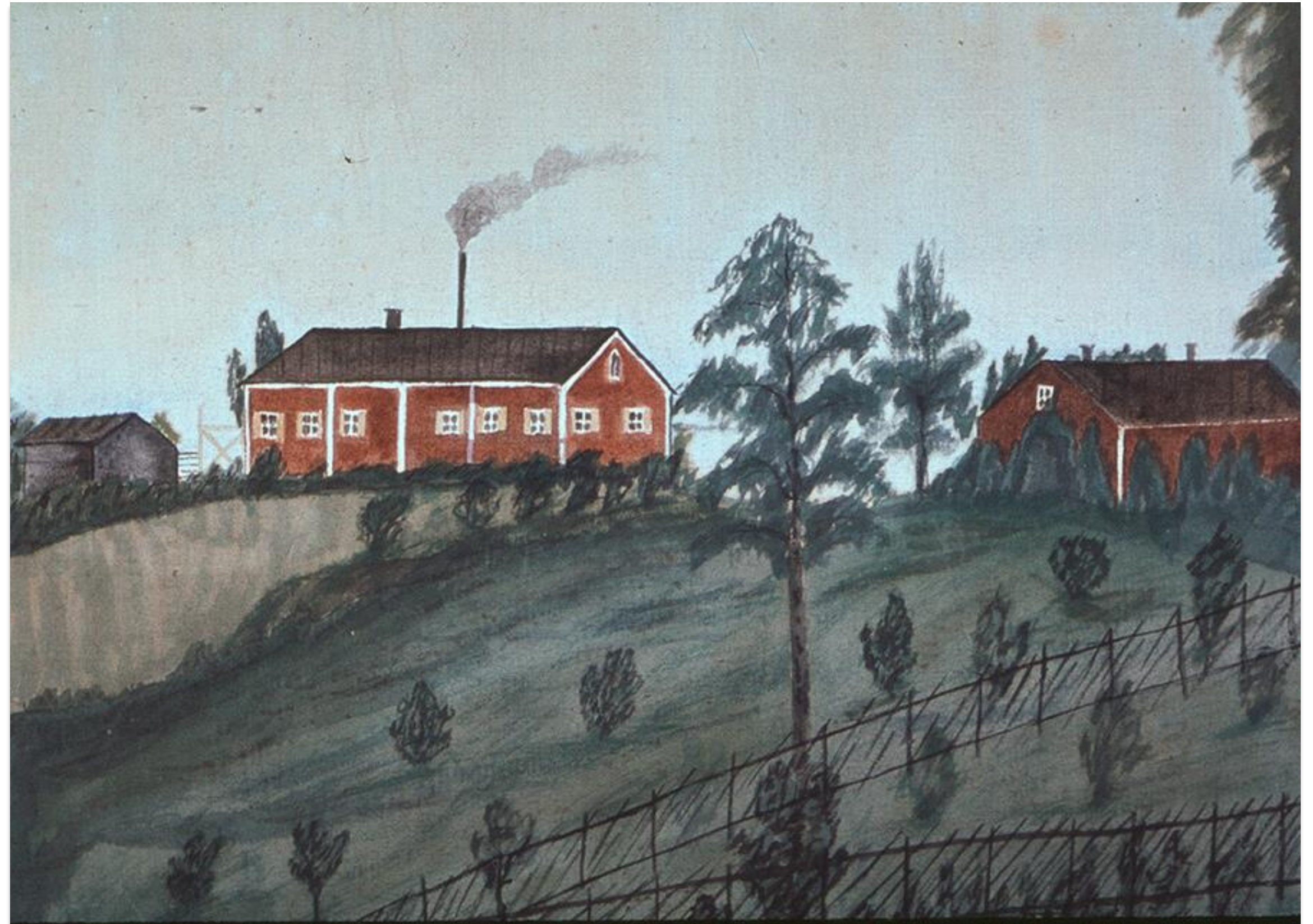
Conrad Sovelius målning av brännvinsbränneriet. Bild K.H.Renlunds museum.