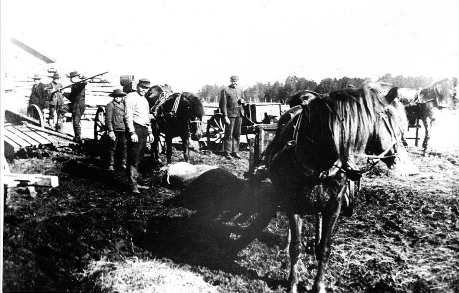
Drank hämtas.