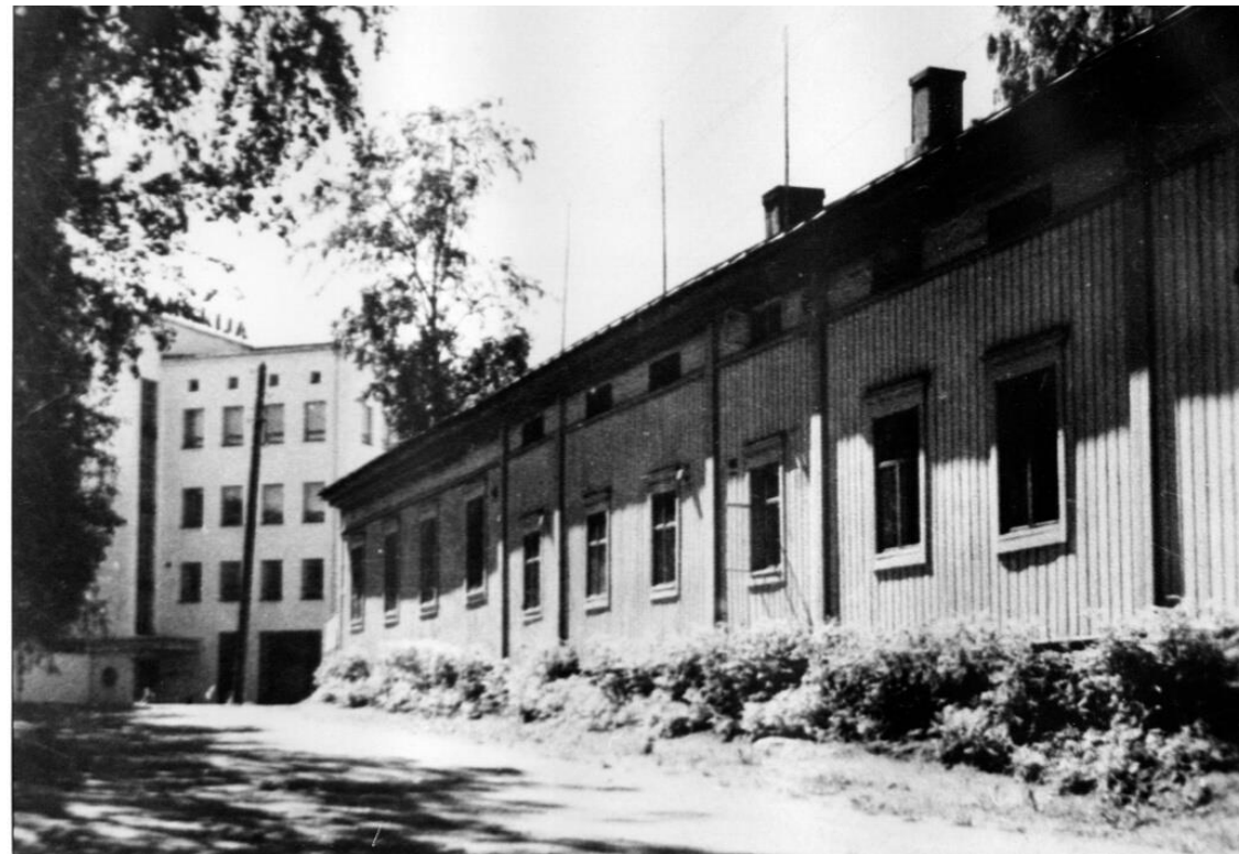
Bryggeriets bostadshus på Tullvägen på 1940-talet, (nuv. Fabriksgatan 20 b).

År 1955 hade Gamlakarleby Bryggeri 43 anställda. År 1956 tillverkade man 2 miljoner flaskor öl. och 1,6 miljoner flaskor läskedrycker. Dagsproduktionen för bryggeriets två pannor var då 20 000 liter.