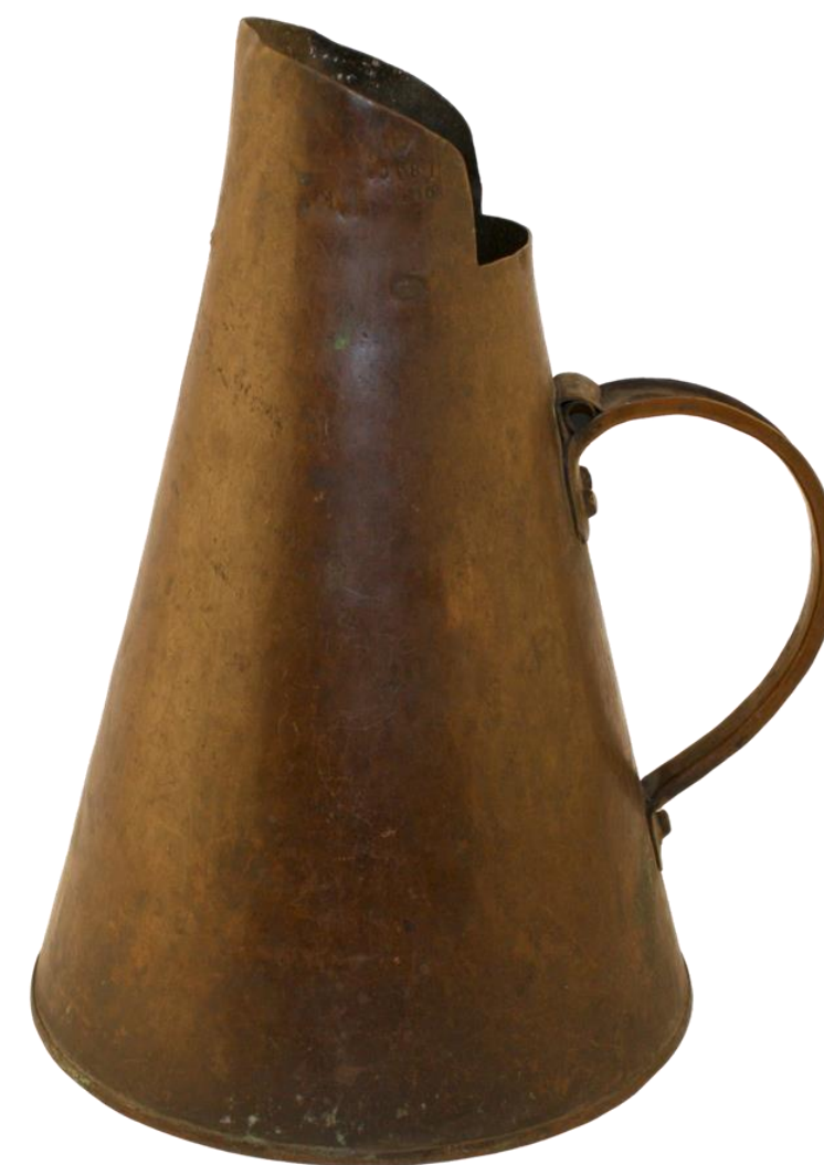
Mättkanna för brännvin. K.H.Renlunds museum.