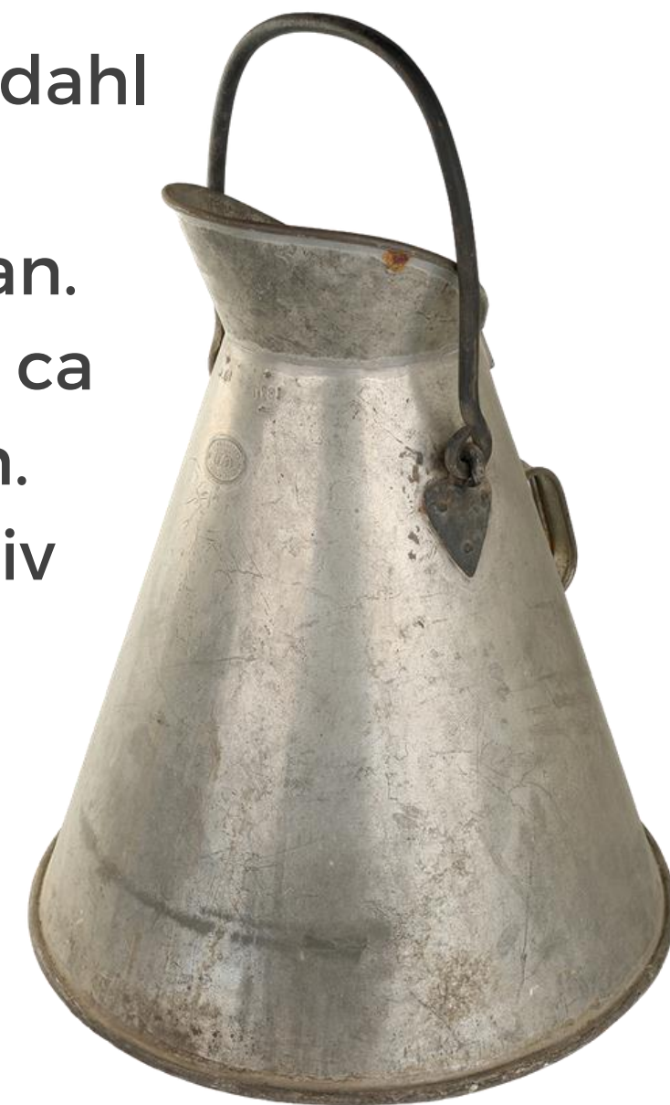
Ett brännvinsmått som troligen användes vid ett av brännerierna i Gamlakarleby. K.H.Renlunds museum.