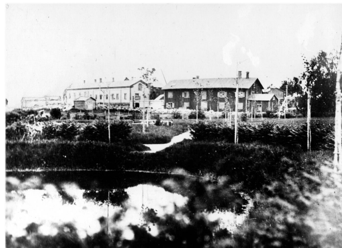
Bryggeriet och Västra parkens "pott". Enligt uppgifterna på bilden från 1870-talet.