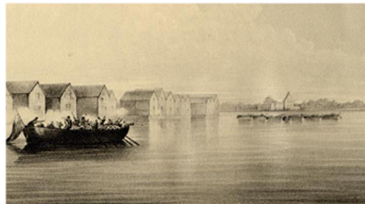
Wladimir Swertschkoffs litografi med motiv över slaget vid Halkokari (detalj). Brännvinsbränneriet i bakgrunden till höger på bilden. K.H.Renlunds museum.

Brännvinstillverkningen kom till Finland med soldater på 1500-talet. Den industriella alkoholframställningen fick sin början i vårt land då kronobrännerierna grundades. De första produkterna såldes 1776. Den första starkdrycksfabriken i Finland grundades i Helsingfors 1842. Hembränning av brännvin förbjöds år 1866 i Finland. Efter detta grundades många ölbryggerier, destillerier och brännvinsbrännerier i landet. År 1875 var de som flest; 83 starkvinsfabriker och 62 brännerier.