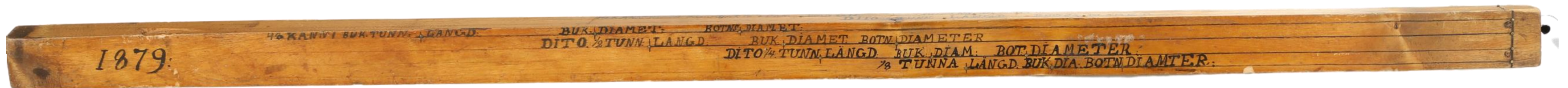
En måttkäpp som användes till att mäta tunnors och kärles inre mått/volym i Gamlakarleby gamla brännvinsbränneri. K.H.Renlunds museum.

A.L. Hagström. Tidningen Kokkola 22.12.1987