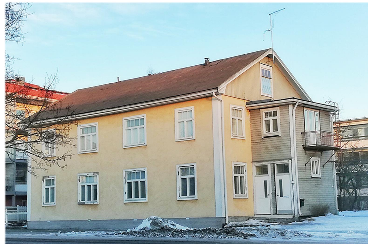
Karlebygatan 38, år 2019.