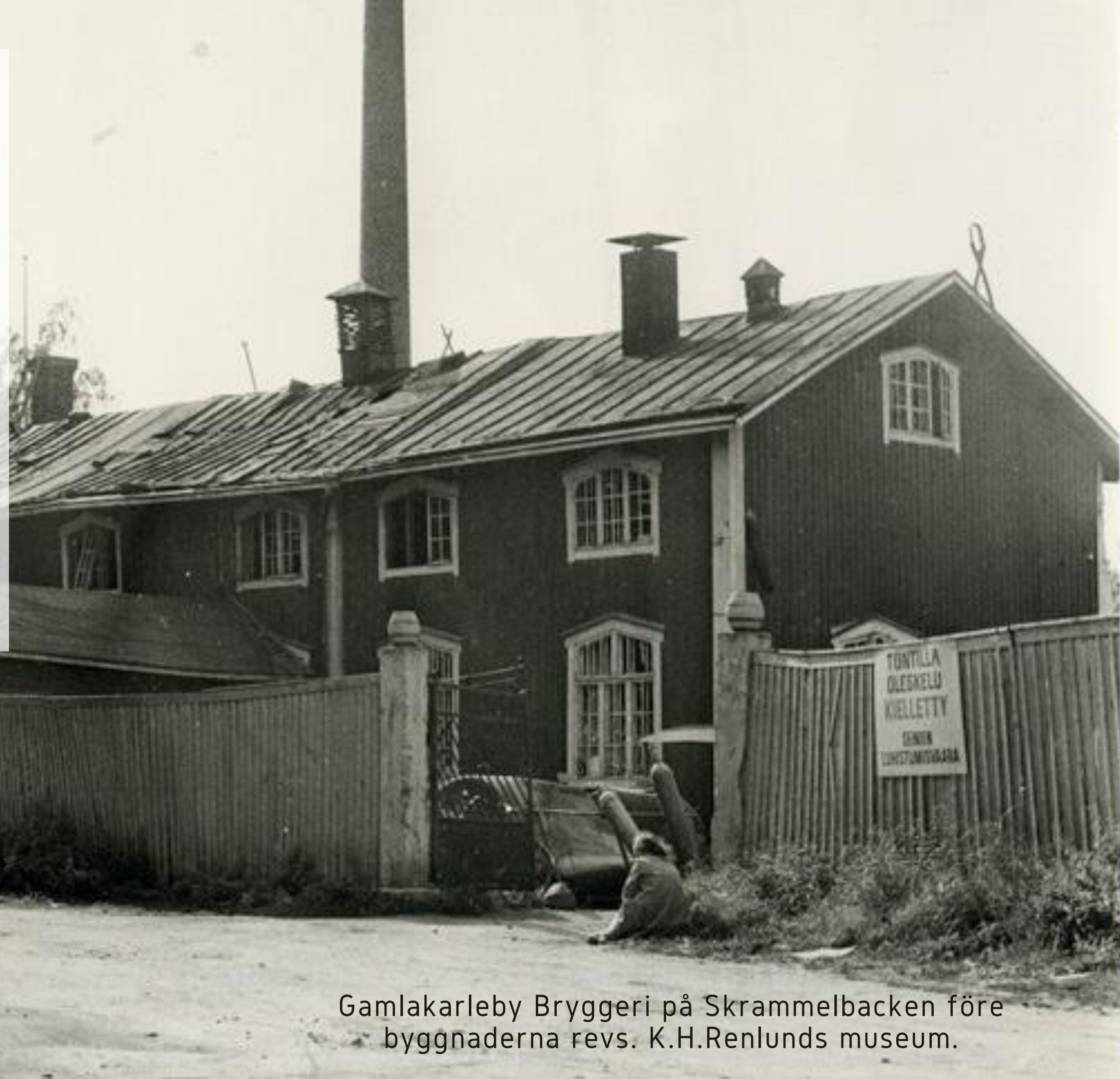
Gamlakarleby Bryggeri på Skrammelbacken före byggnaderna revs.

Statens Alkoholrörelse försökte rätta till missförhållandet genom att utöka Gamlakarleby försäljningsområde, vilket fabriken inte klarade av. Man försökte också sälja fabriken till BOCK men på grund av fabriken ringa storlek och dåliga skick fick man inte ens förhandlingar till stånd. Man beslöt att lägga ner fabriken och tillverkningen av öl och andra drycker avslutades 1959. Bolaget upplöstes följande år.