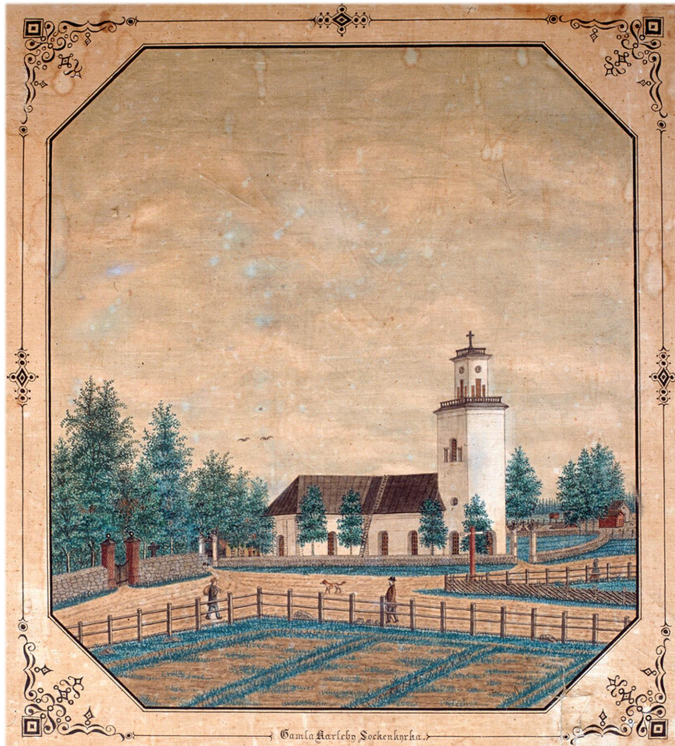
Conrad Sovelius: Karleby kyrka.