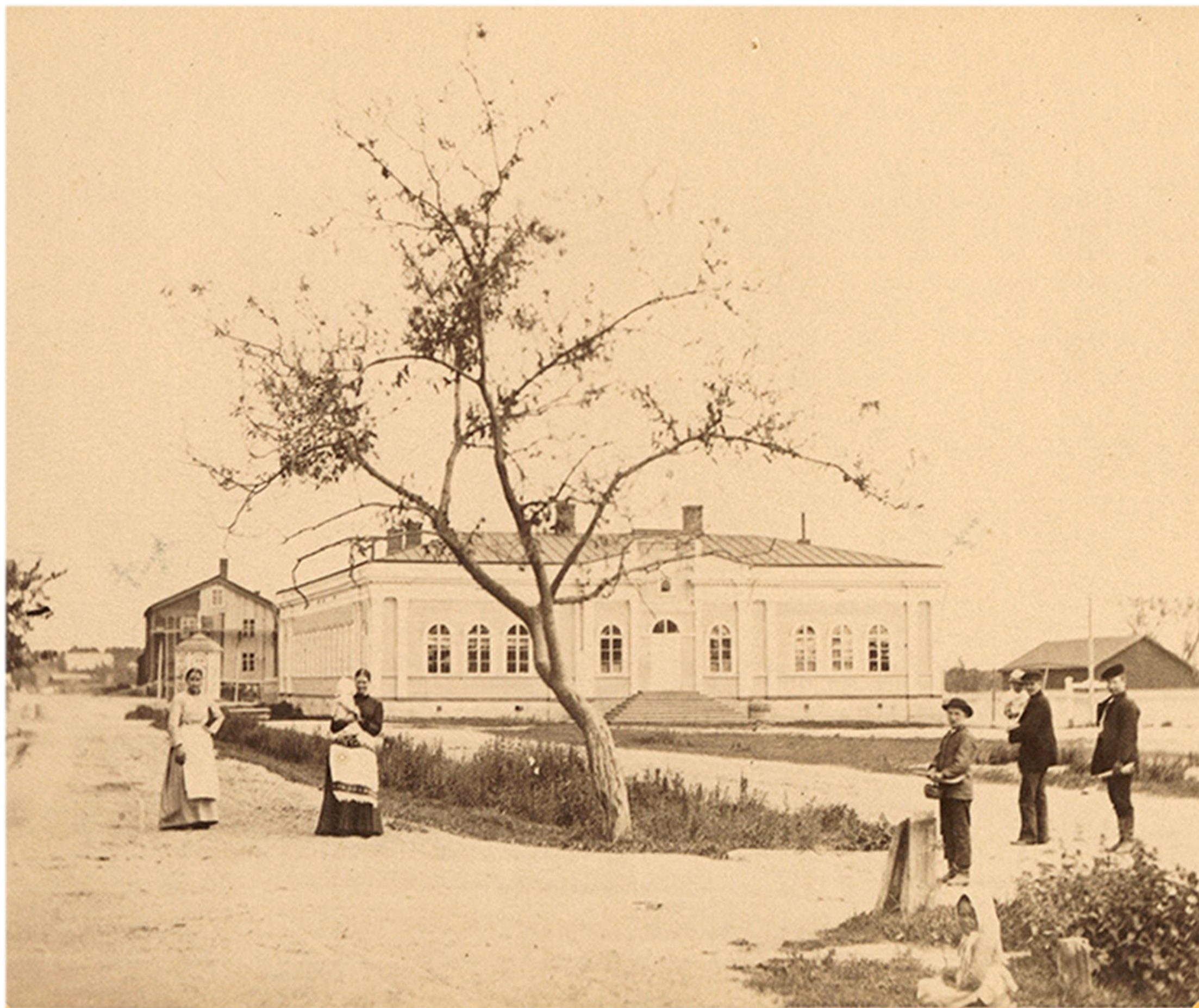
Högre elementarskolan från 1866 i hörnet av Storgatan och Fabriksgatan, ritad av arkitekten L.I. Lindqvist. Skolan brann 1990.