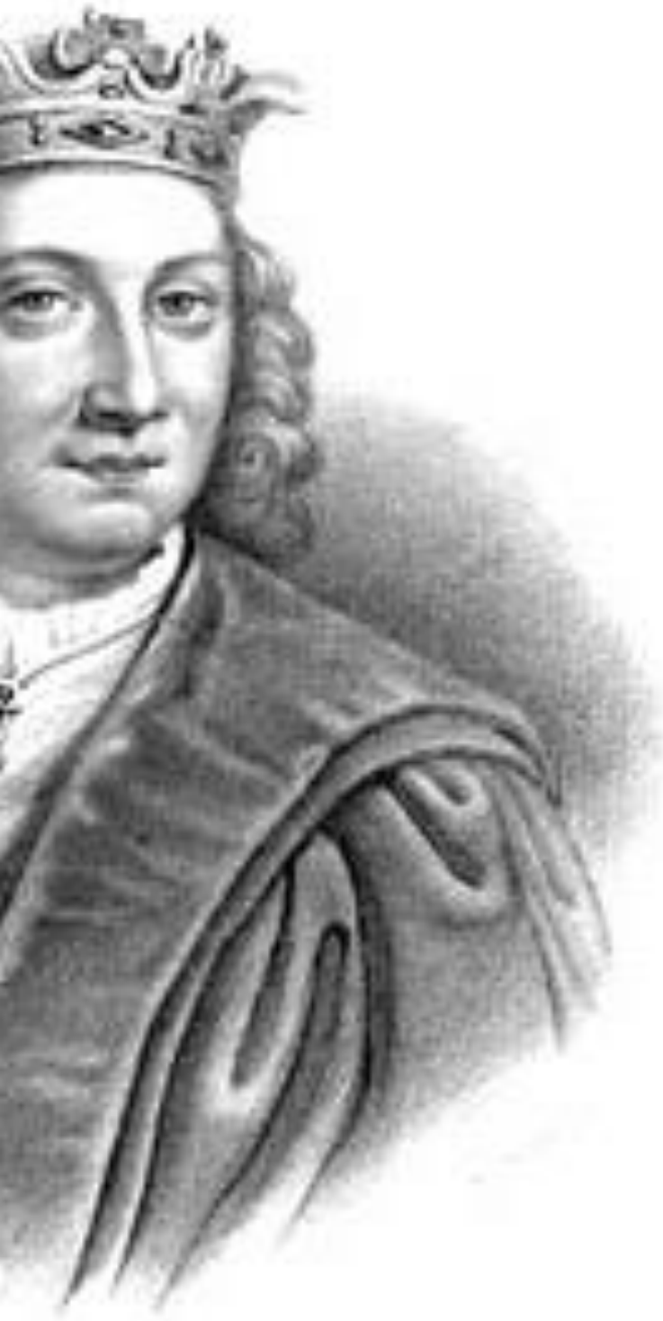
Karl den VIII