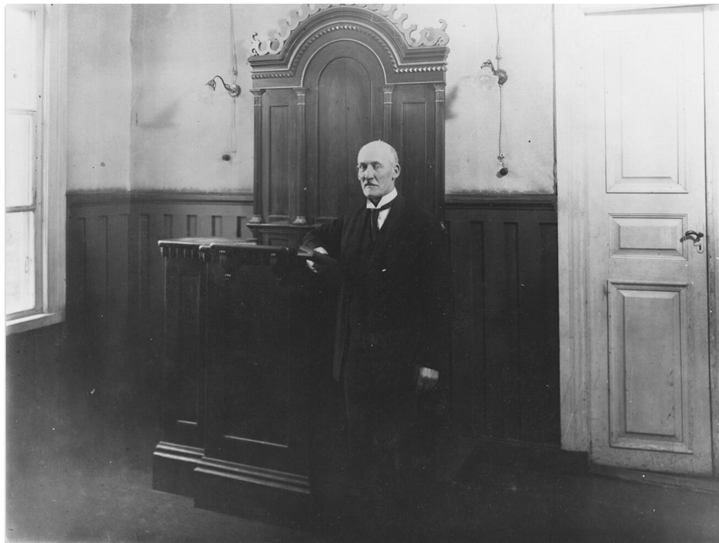
J.F. Sandelin. Vi Neristassbor rf, Karleby hembygdsarkiv.