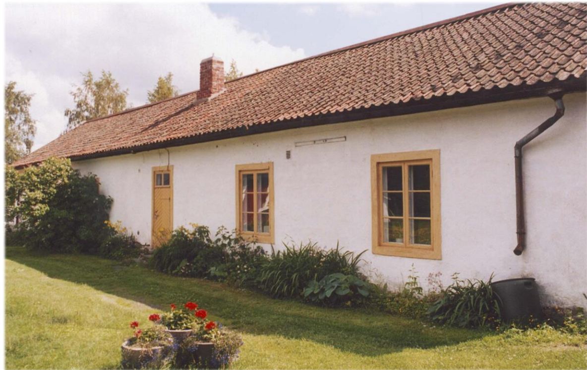
Kaarlelan pappilan tiilinen talousrakennus.

Kirkkoherra rakennutti 1775 Kaarlelan pappilan pihalle suunnittelemansa tiilirunkoisen talousrakennuksen. Kaarlelan kirkon laajennusta oli alettu suunnitella jo 1760-luvulla, mutta se valmistui vasta 1789. On mahdollista, että talousrakennus oli hanke, jossa tutustuttiin uuteen materiaaliin tiileen kirkon laajentamista varten.