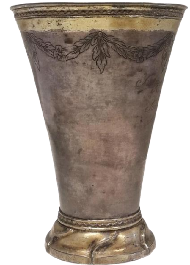
Rasmuksen pokaali (yksityisomistuksessa)