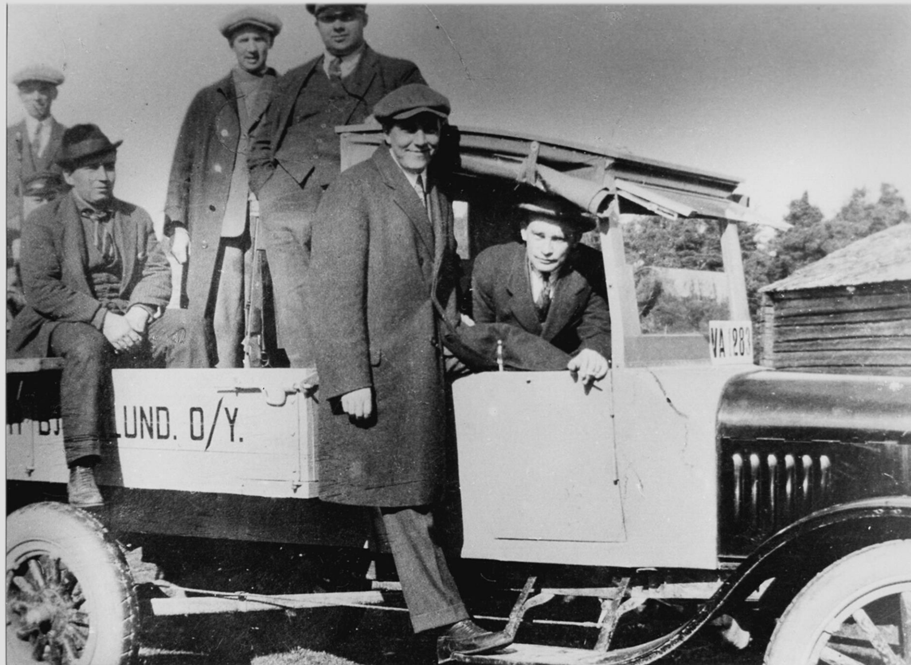
Vi Neristassbor rf, Kokkolan kotiseutuarkisto.

Pääliikkeidensä lisäksi Björklundilla oli parhaimmillaan seitsemän haaraliikettä mm. Kälviällä, Kannuksessa, Haapavedellä, Pulkkilassa, Vetelissä ja Pihtiputaalla. Liikkeisiin hankki tavaraa Kokkolassa toiminut tukkuliike ja kuljetukset maaseudulle hoidettiin hevosilla. Björklund harjoitti myös ulkomaankauppaa ja toi maahan mm. kahvia, jauhoja ja sokeria, kankaita, työkaluja ja paloöljyä. Suurin vientiartikkeli oli terva.