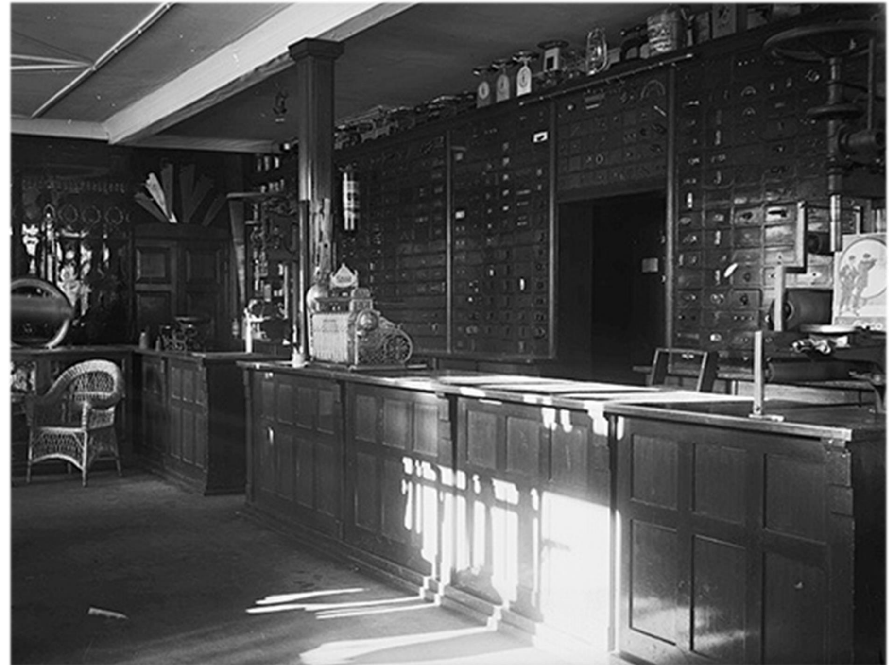
Björklundin rautakauppa 1923.