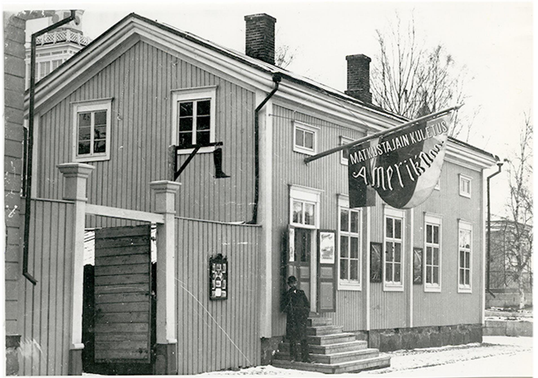
I hörnet av Östra Kyrkogatan och Lilla Kyrkogatan kunde man hämta ut biljetter för Amerikaresor.

Emigrationen till Amerika ökade gradvis fr.o.m. hungeråren på 1860-talet och kulmen nåddes under åren 1902-1913. I slutet av 1800-talet fick ett ekonomiskt uppsving sin början. Detta, samt i någon mån det olagliga ryska uppbådet år 1901, ökade emigrationen. Sett till landets befolkningsmängd var det flest mellersta och sydösterbottningar som emigrerade från Finland. Toholampi hade den högsta emigrationen av Mellersta Österbottens alla kommuner och från hela landskapet emigrerade 40 000 personer under åren 1870-1914.