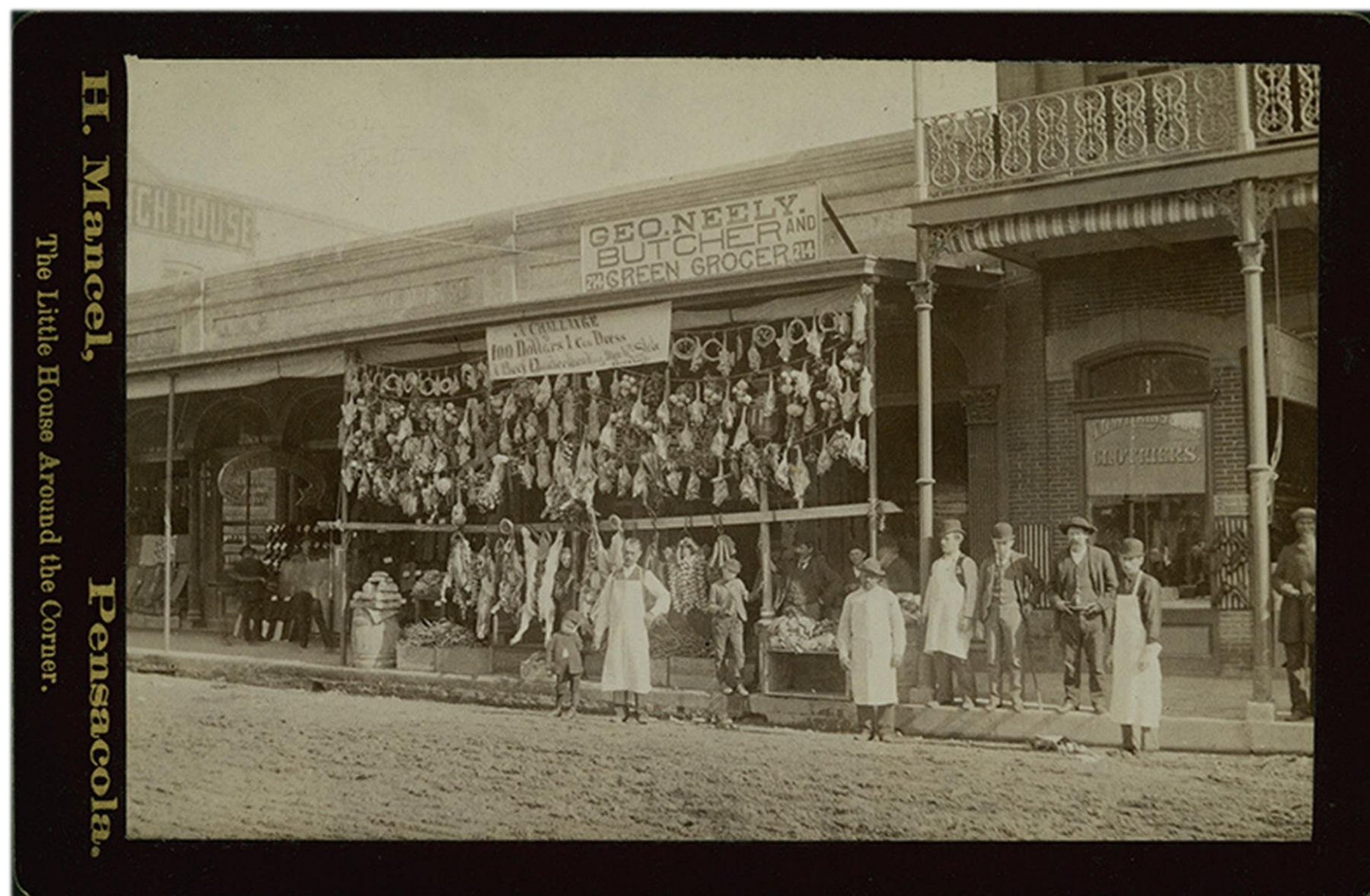
Kött- och grönsakshandel i Pensacola, Florida.

Orsakerna till den stora emigrati- onen från kusttrakterna har förkla- rats med det nedärvda sättet att flytta dit där arbete fanns samt med sjöfartstraditionen. Det blev nästan en lokal tradition, som amerika- farare och -återvändande närde genom sina berättelser om utmärk- ta, likvärdiga förtjänstmöjligheter. Också arbetslösheten satte folk i rörelse.